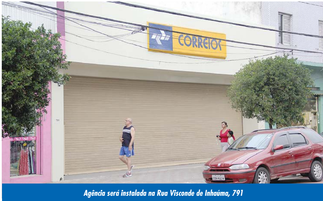
Agência será instalada na Rua Visconde de Inhaúma, 791

Vereador Flavio Rstom apresentou requerimento em 2011