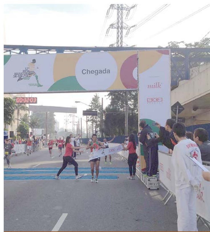
Evento acontece há mais de doze anos na região

Os cinco primeiros das provas de 10 e 21km, nas categorias feminino, masculino e por idade receberam troféus.