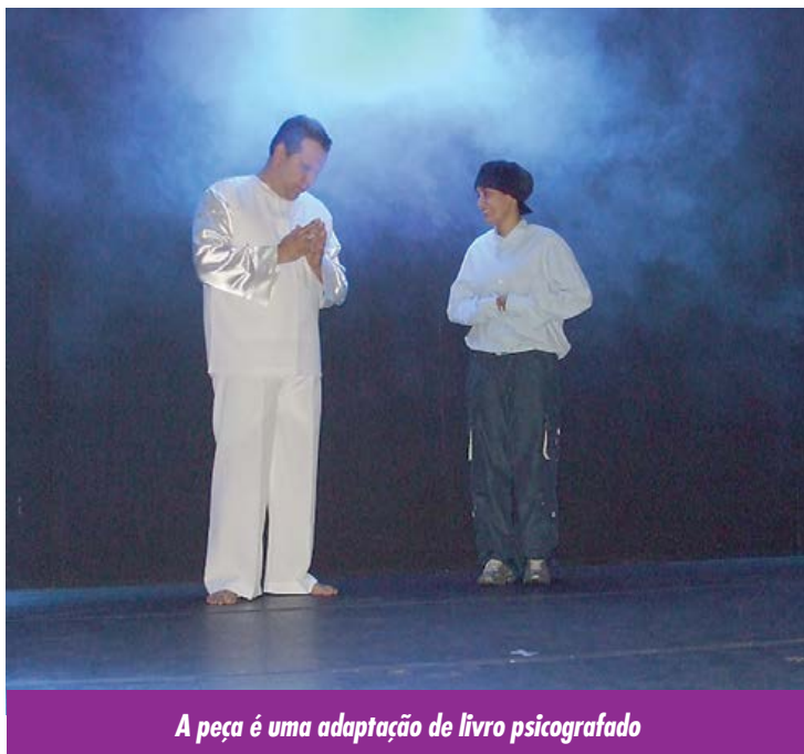
A peça é uma adaptação de livro psicografado