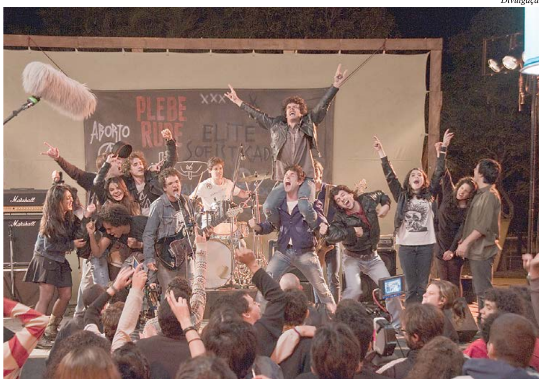
Nas cenas musicais do filme a captação de som do show é original