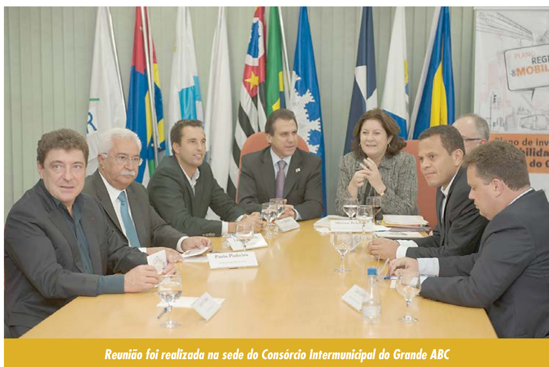
Reunião foi realizada na sede do Consórcio Intermunicipal do Grande ABC

Os prefeitos das sete cidades da região entregaram o Plano de Investimentos em Mobilidade Urbana na Região do Grande ABC à ministra do Planejamento, Orçamento e Gestão, Miriam Belchior. O pacote regional de intervenções dá prioridade ao transporte