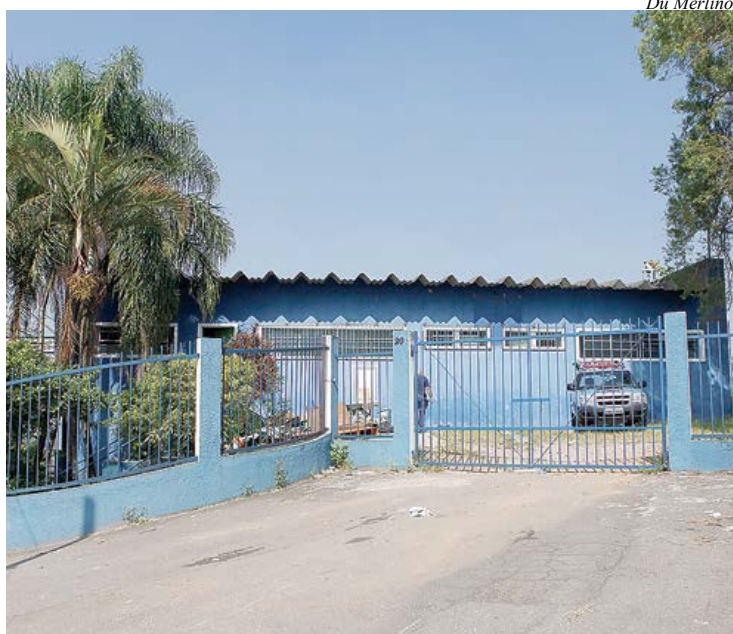
Mudança trará mais segurança na divisa com São Paulo

Alteração visa oferecer melhores condições de trabalho e combater ações criminosas na entrada da cidade