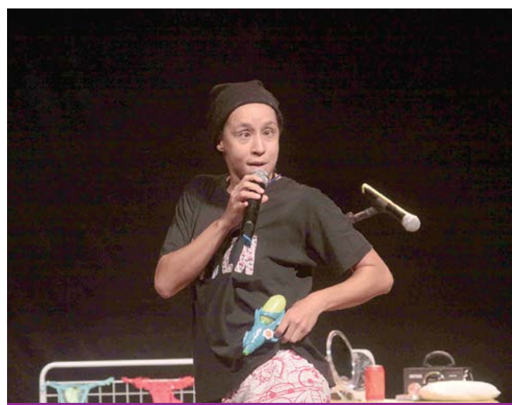
Artista faz interpretação de quatro personagens

O espetáculo será apresentado no domingo (05), às 19 horas, no Teatro Municipal de Santo André (Praça IV Centenário - Centro de Santo André). Mais informações: 4433-0789/2809-1907 ou acesse www.vibrarte.com.br