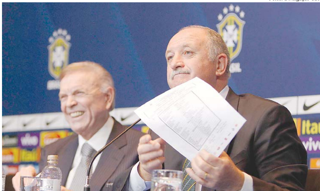
Treinador exhibe a lista dos jogadores que defenderão a Seleção Brasileira