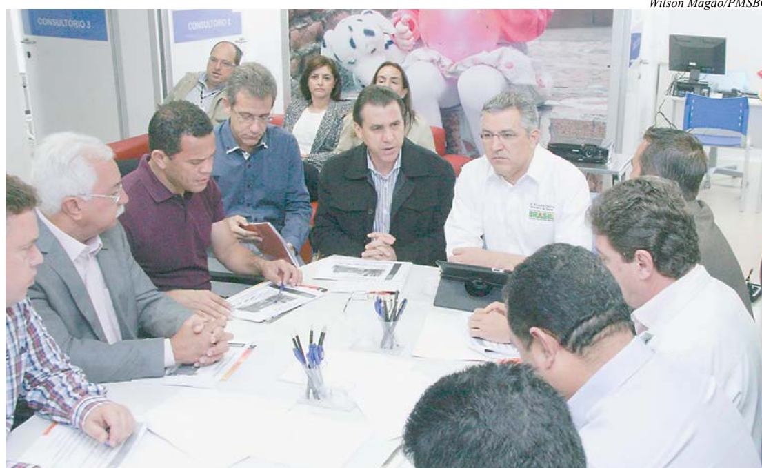
Prefeitos se reuniram com o ministro Alexandre Padilha em São Bernardo do Campo

O Ministro da Saúde, Alexandre Padilha, anunciou dia 11, em São Bernardo do Campo, após encontro com os sete prefeitos da região, a liberação de R$ 53 milhões para a construção de centros especializados no atendimento à dependência química nos municípios do ABC. Ao todo, serão 20 Centros de Atenção Psicossocial (CAPs) e oito residências terapêuticas. "O problema do uso de drogas, sobretudo entre a juventude, é urgente e nenhum município vai resolver sozinho. Por isso a ideia do Consórcio é importante. Vamos criar no ABC uma grande rede de acolhimento", disse Padilha.