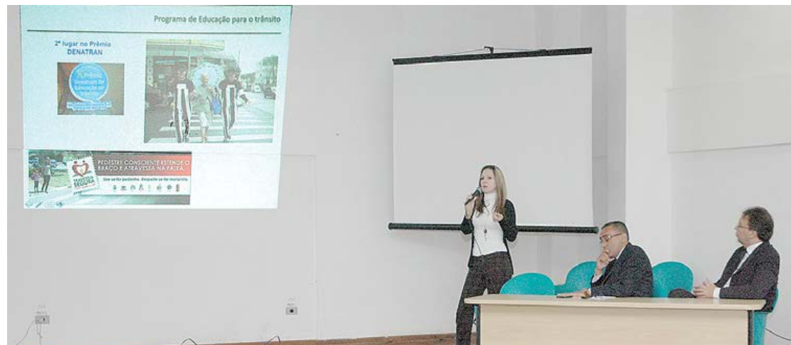
Benefício vale para troca de veículos, adaptação veicular e até para a compra de óculos

Taxistas podem comprar um novo veículo com juros diferenciados