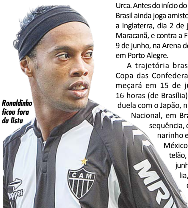
Ronaldinho ficou fora da lista

A trajetória brasileira na Copa das Confederações começará em 15 de junho, às 16 horas (de Brasília), quando duela com o Japão, no Estádio Nacional, em Brasília. Na sequência, o time canarinho enfrenta o México, no Castelão, em 19 de junho, e a Itália, três dias depois, no Maracanã.