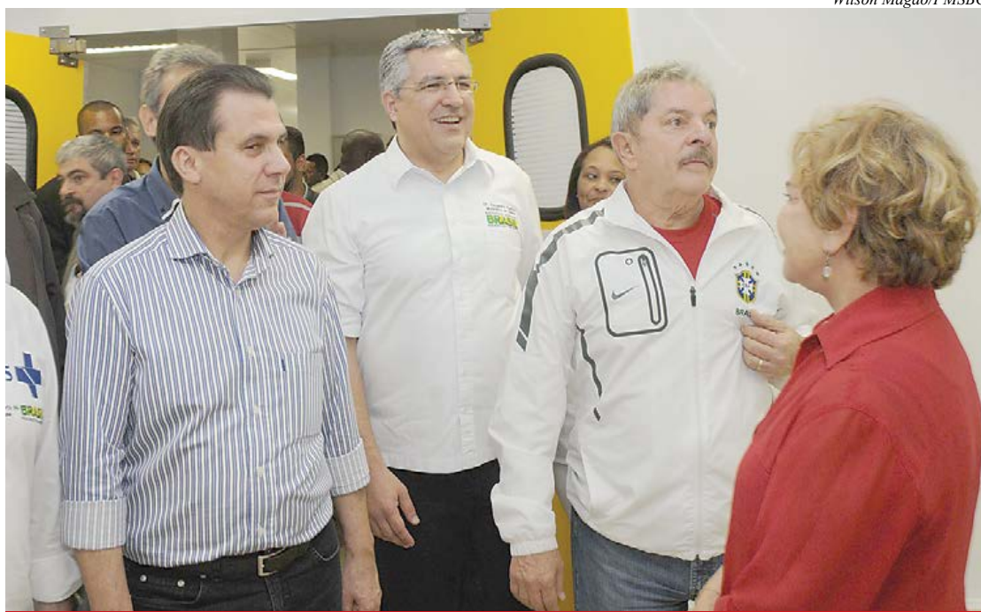
São Bernardo é a primeira cidade da região a completar a rede de UPAs

Para o prefeito, com mais esta unidade, São Bernardo está construindo uma das melhores redes básicas de saúde do País e avançando muito no atendimento de urgências. "A saúde pública do município está atendendo mais e melhor que a saúde privada. Recebo di-