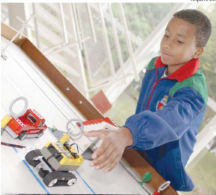
Atividades são para todas as idades

O Centro Digital de São Caetano abriu nesta semana inscrições para 39 oficinas gratuitas que oferecerá em junho, em diversos dias e horários. São oferecidas atividades para estudantes da Educação Infantil, Ensino Fundamental e Médio de escolas sancaetanenses, públicas e particulares, e também para adultos, municipais ou comerciantes da cidade. Os interessados devem se