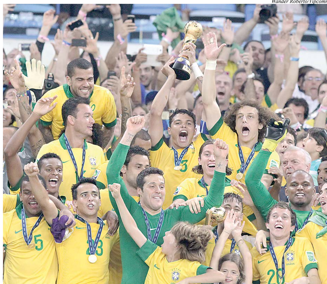
Brasil venceu a Espanha e conquistou a Copa das Confederações

Sobre o legado do evento, 48% dos entrevistados afirmaram que o Mundial trará mais benefícios do que prejuízos. Outros 44% avaliam que haverá mais prejuízos que benefícios. Oito por cento não souberam opinar.