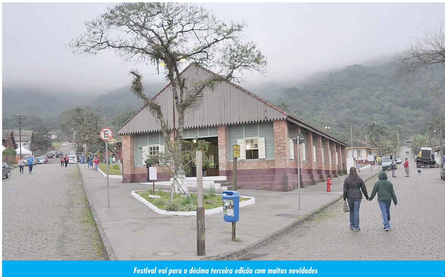
Festival vai para a décima terceira edição com muitas novidades