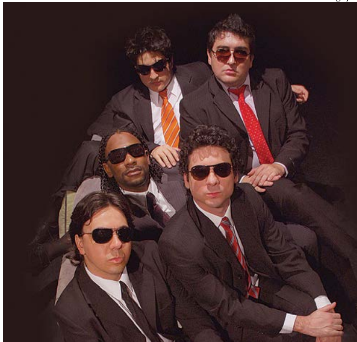
Espectáculo será apresentado no dia 07 de julho

Adaptação da obra As mentiras que os homens contam, de Luís Fernando Veríssimo, a peça Por que os homens mentem? estará no Teatro Paulo Machado de Carvalho (Alameda Conde de Porto Alegre, 840 – Bairro Santa Maria) neste domingo (7/7), a partir das 19h. O espetáculo conta com dez esquetes que revelam, com humor inteligente, situações onde a mentira pode não ser um ato tão condenável. A classificação é de 12 anos.