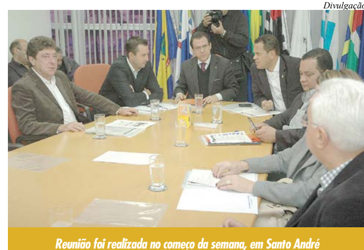
Reunião foi realizada no começo da semana, em Santo André

Entre os compromissos, foi acordado pelos chefes do Executivo, um pacto de respeito aos vínculos existentes, evitando a concorrência predatória entre as prefeituras. “Um levantamento está sendo produzido para o estabelecimento de valores de remuneração do trabalho médico numa faixa média regional, possibilitando estabelecer um patamar equilibrado para