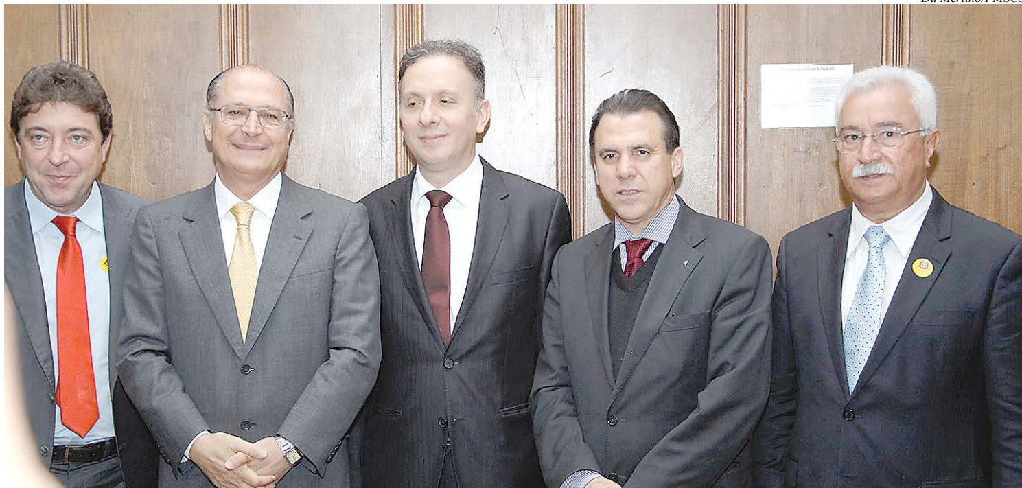
Governador Geraldo Alckmin recebeu os prefeitos da região para anunciar as benfeitorias

A Linha 18-Bronze será construída pelo sistema monotrilho, em investimento total de R$ 3,5 bilhões, sendo 55% custeados por esferas públicas e o restante pela iniciativa privada. Na primeira fase, a linha 18 atenderá os municípios de São Paulo, São Caetano do Sul, Santo André e São Bernardo do Campo. Ela terá