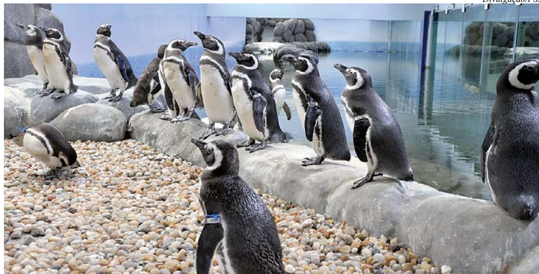
Pinguins de Magalhães conquistam crianças e adultos

Durante o mês de julho, a Sabina Escola Parque do Conhecimento, em Santo André, preparou uma programação diferenciada para oferecer mais opções de lazer e aprendizagem a toda população durante as férias escolares. O espaço está aberto ao público de terça-feira a domingo, das 12h às 18h. Além das já tradicionais atrações do espaço, como o pinguinário, a réplica em tamanho natural do Tyrannosaurus Rex e o Gerador de Van Der Graaf, a equipe elaborou diversas oficinas como a Câmara Escura, Arte Rupestre, Caleidoscópio, Caça ao Conhecimento, Catavento de Newton, Cinema Stop Motion, Construção de Pipas e Construção de Instrumentos Alternativos.