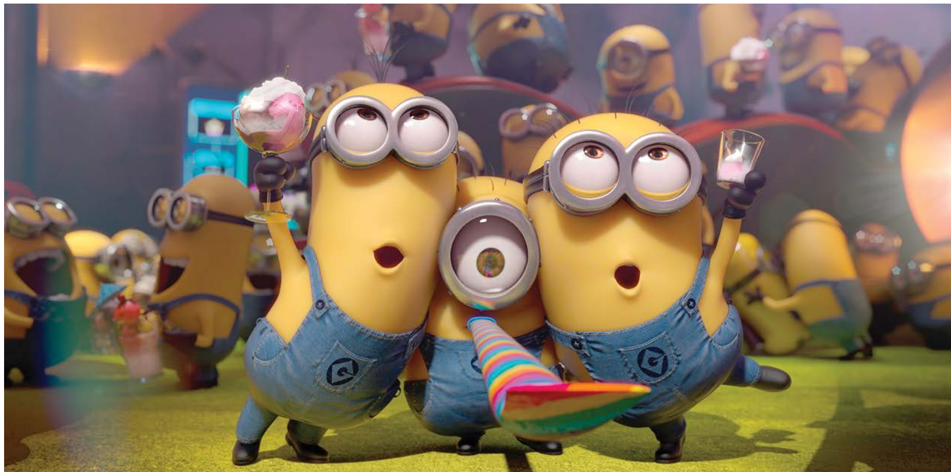
Os imprevisíveis Minions roubam a cena no novo filme

Continuação do sucesso Meu Malvado Favorito terá versão em 3D