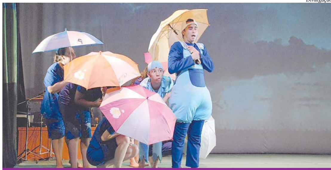
Todas as atividades são gratuitas e direcionadas ao público com idade a partir de oito anos

O Sesi-SP abre inscrições para os cursos gratuitos de iniciação teatral oferecidos pelos Núcleos de Artes Cênicas nas unidades de A.E. Carvalho, Mauá, Santo André, Osasco, Vila Leopoldina e Vila das Mer-