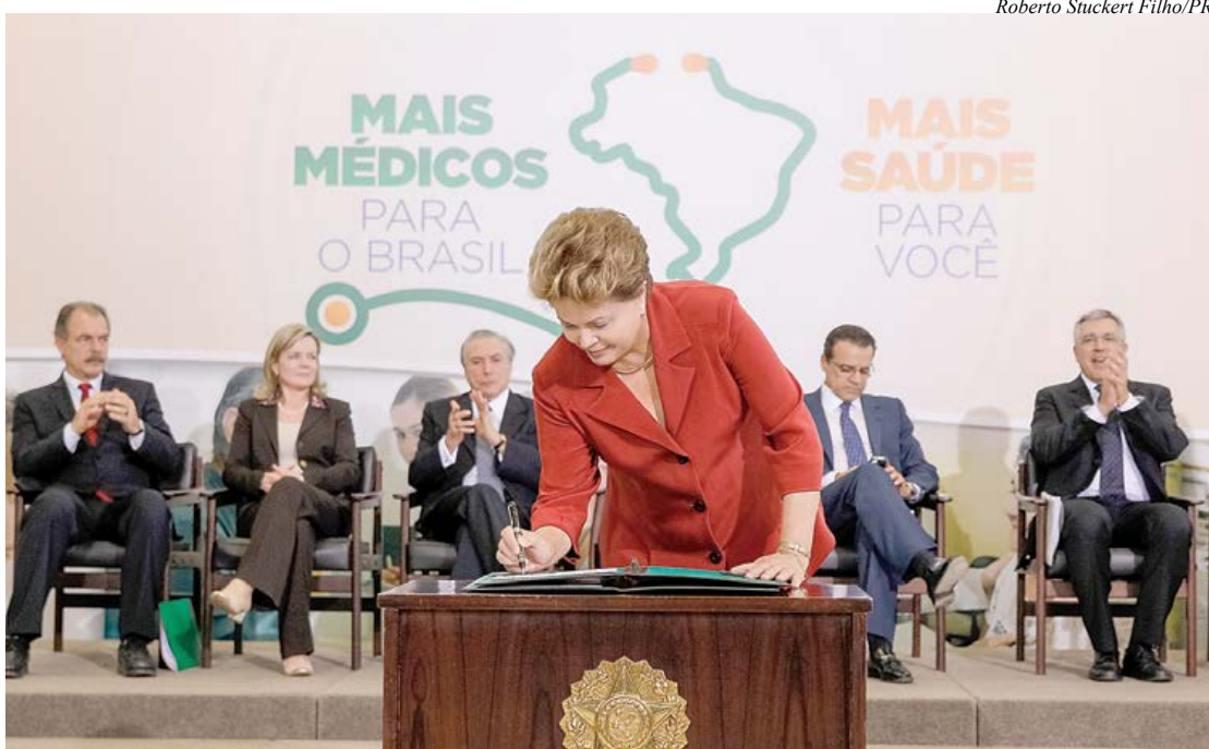
Presidenta Dilma Rousseff durante cerimônia de lançamento do Pacto Nacional Pela Saúde

Já estão abertas as inscrições de médicos para participar do Programa Mais Médicos e também a adesão dos municípios ao programa, que objetiva assegurar a presença de médicos em áreas do país carentes destes profissionais. Para os médicos, o prazo para inscrição vai até o dia 25 de julho. Os municípios interessados também devem aderir ao programa até esta data. Página 4