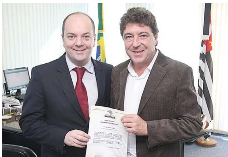
Rogério Hamam e Carlos Grana assinam parceria

A região da Vila Metalúrgica vai ganhar uma nova creche com capacidade para cerca de 180 crianças de até cinco anos. O termo de parceria para a construção da unidade foi assinado pelo prefeito de Santo André, Carlos Grana, e o secretário Estadual de Desenvolvimento Social, Rogério Hamam. O acordo faz parte do programa estadual Creche Escola para ampliar o aumento de creches em São Paulo e estabelece que o município fornecerá o terreno e o Governo do Estado ficará responsável pela obra. Página 6