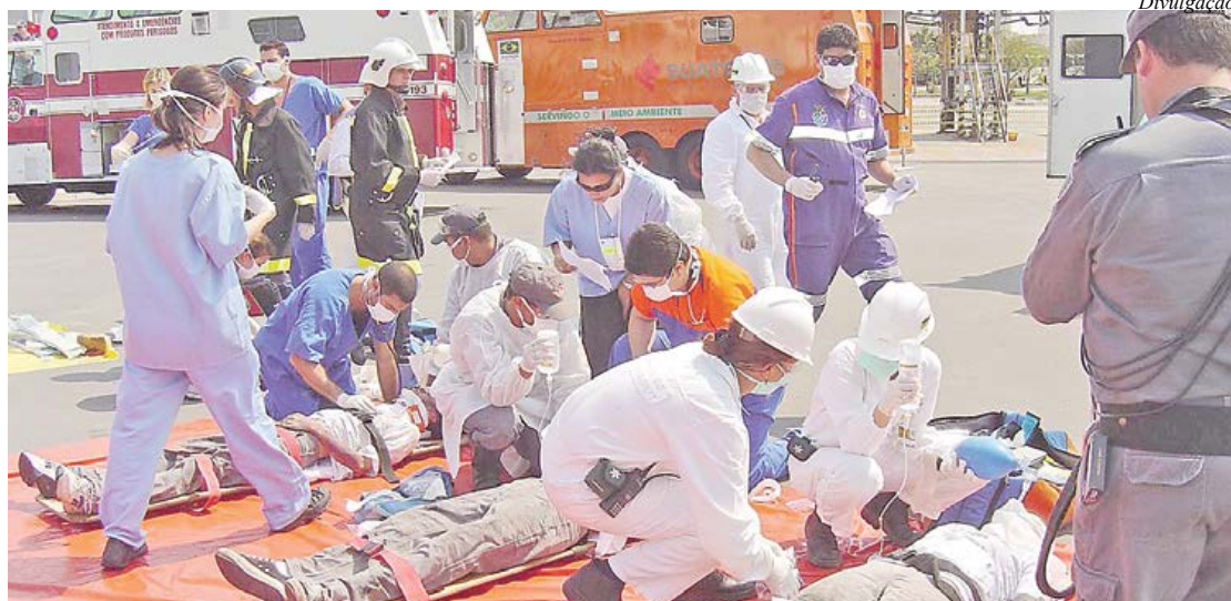
Treinamentos para as equipes de resgate são constantes

SAMU de Santo André fará treinamento na segunda-feira, dia 15