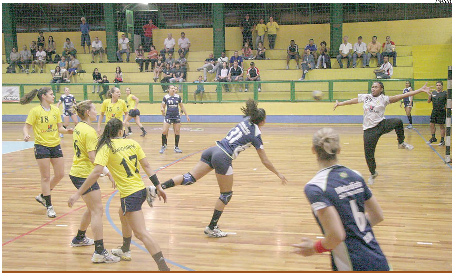
Handebol feminino de São Bernardo é favorito na modalidade

Na primeira divisão, São Bernardo terá a companhia de Santos, São Caetano, Santo André, Cubatão, Guarujá, Mongaguá, Osasco, Praia Grande e Ribeirão Pires. No ano passado, a delegação são-bernardense