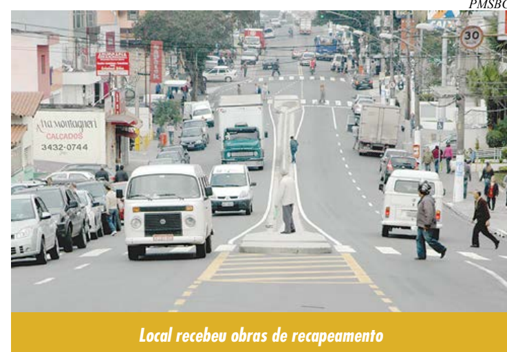
Local recebeu obras de recapeamento

Uma das situações que aumentavam o risco de acidentes, segundo os técnicos,