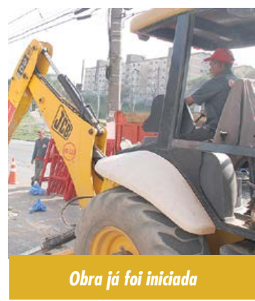
Obra já foi iniciada

idez do trânsito. “Embora seja uma obra bastante pontual para atender as comunidades de Sacadura Cabral e Tamarutaca, é de grande importância para a mobilidade urbana regional por conta do Corredor ABD, via que liga a região ao Litoral e ao Rodoanel pela Via Anchieta. Vamos eliminar dois semáforos, o que diminuirá a formação de gargalos, aumentando a fluidez do trânsito no trecho”, assegura.