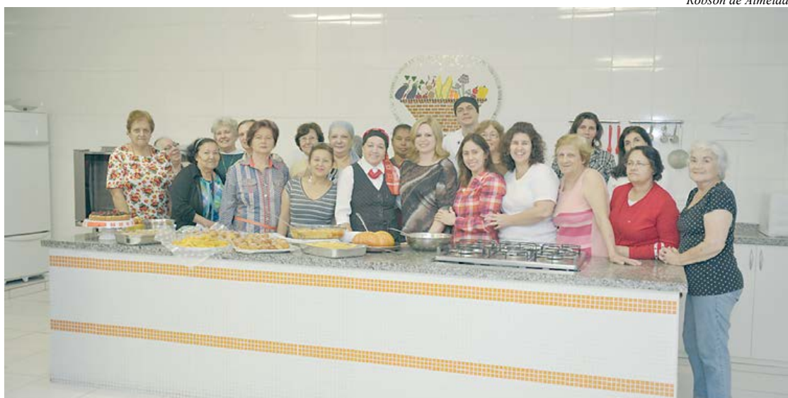
Fundo Social oferece cursos de capacitação profissional

Na próxima segunda-feira (15/7), o Fundo Social de Solidariedade de São Caetano do Sul abre inscrições para cursos de capacitação profissional aos munícipes. As aulas são gratuitas e terão início em 5 de agosto. Neste segundo semes-