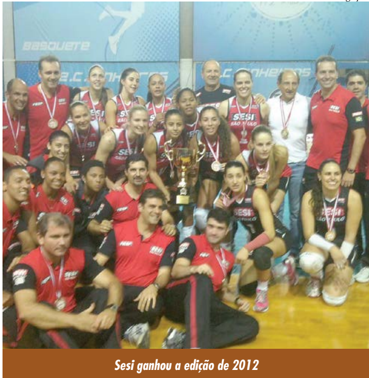
Sesi ganhou a edição de 2012

O voleibol feminino adulto paulista, da Divisão Especial, começará suas atividades no mês de agosto, mais precisamente no dia 9, com a realização da Copa São Paulo. A tradicional competição, que serve de preparação para o Campeonato Paulista 2013, reunirá sete das oito equipes que participarão do principal torneio regional do país. Vôlei Amil, Sesi-SP, Pinheiros, Uniara/FAV, São Bernardo, São Cristovão Saúde/São Caetano e Jacareí/Sedex são os times confirmados. Osasco, atual campeão paulista, não participará da Copa São Paulo 2013.