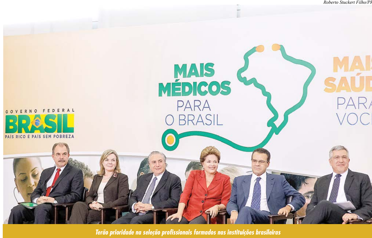
Terão prioridade na seleção profissionais formados nas instituições brasileiras

O número de vagas disponíveis vai depender da demanda a ser apresentada pelos municípios. No ato da adesão,