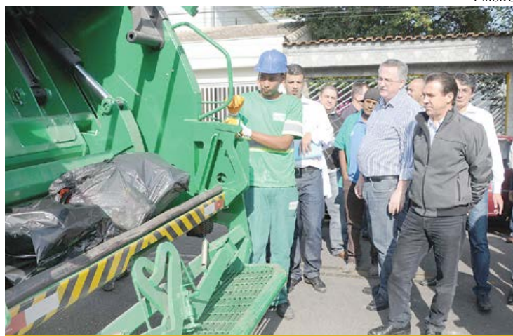
Bairros Paulicéia e Jordanópolis vão receber coleta

O sucesso da coleta seletiva porta a porta, implantado no dia 5 de junho de forma experimental no Rudge Ramos, vai ser expandido para os bairros Paulicéia e Jordanópolis, que recebem o serviço a partir do dia 3 de setembro.