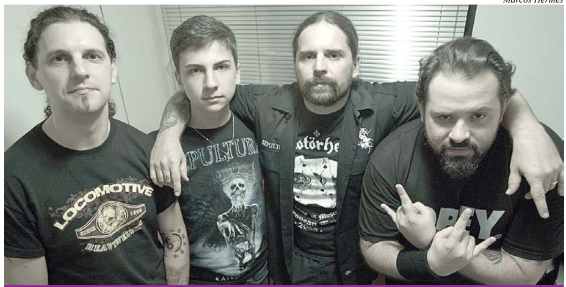
Músicos possuem trabalhos reconhecidos por crítica e público

Em comemoração aos 136 anos da cidade de São Caetano do Sul, o Sesc e a Secretaria Municipal de Cultura da cidade apresentam o projeto Lado B. A ação consiste em apresentações musicais de quatro artistas oriundos de bandas de Rock, Pop Rock e Metal brasileiras, que cantam