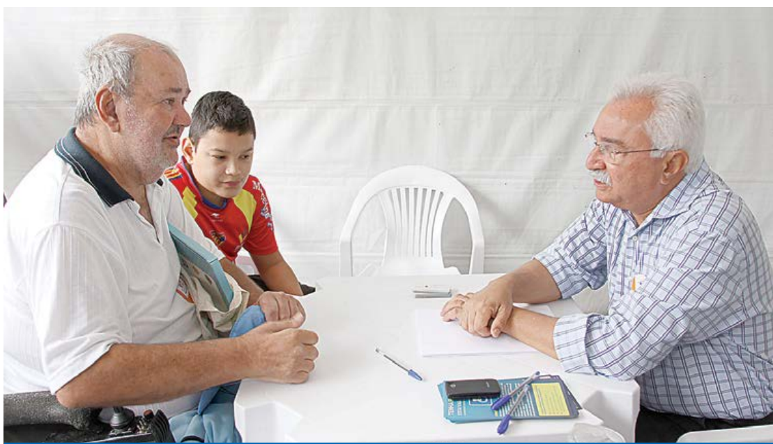
Prefeito Paulo Pinheiro vai atender moradores de São Caetano do Sul

Os moradores dos bairros Cerâmica e Oswaldo Cruz serão os próximos beneficiados pelo Programa Prefeitura Perto de Você, ferramenta de aproximação com o poder público criada pelo atual governo de