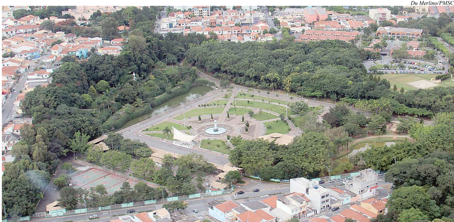
Espaço Verde Chico Mendes vai receber o Programa no próximo sábado

“Convido toda a população de São Caetano a comparecer ao Chico Mendes neste sábado. Lá vamos facilitar o acesso a diversos serviços da Prefeitura,