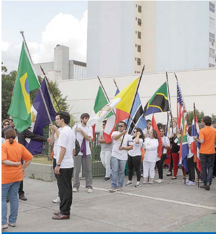
Encontro foi realizado no Espaço Estação Jovem