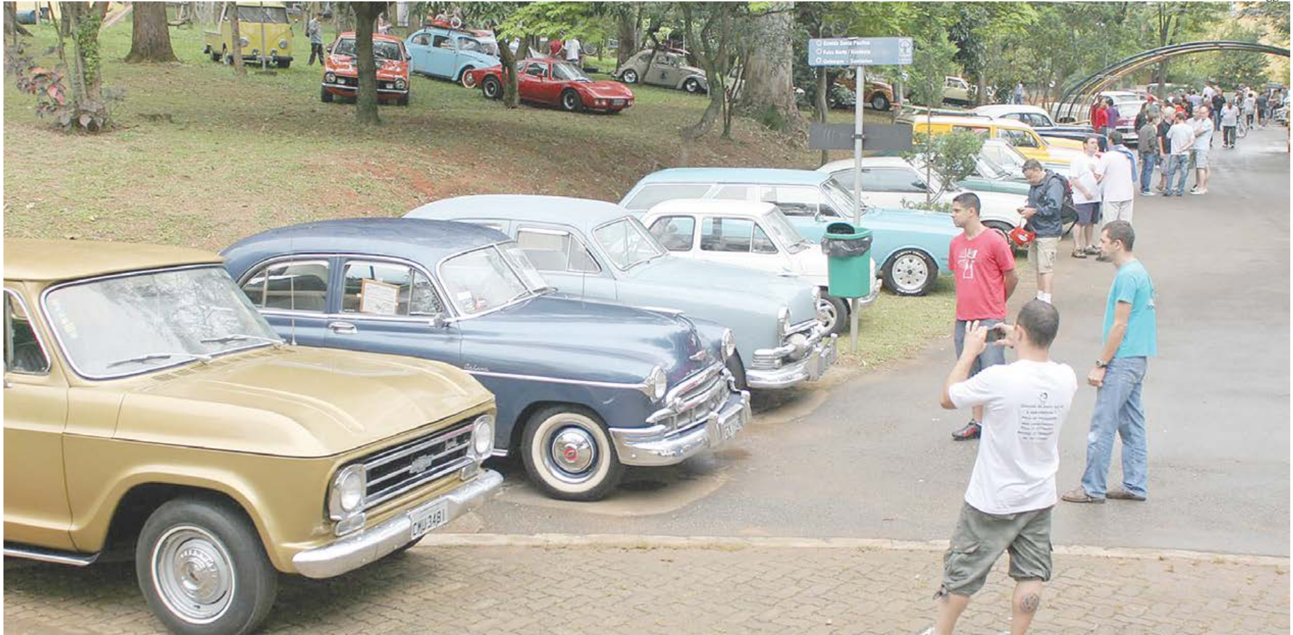
Diversas marcas e modelos estarão expostas no Bosque do Povo

A Associação de Autos Antigos e Especiais do ABC, em parceria com a Secretaria Municipal de Cultura da Prefeitura de São Caetano do Sul, promove uma nova edição do Antigos no Bosque, um encontro que,