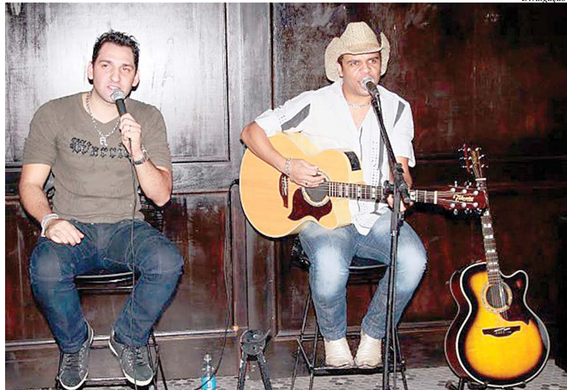
Atração contará com show da dupla sertaneja Roger e Robson

Também como parte dos Festejos da cidade, no sábado e domingo (21/7), das 14 às 23h, ocorre o segundo fim de semana da 1ª Festa Julina dos clubes esportivos de São Caetano do Sul. O arraial conta com atividades culturais, comidas típicas e tem entrada gratuita.