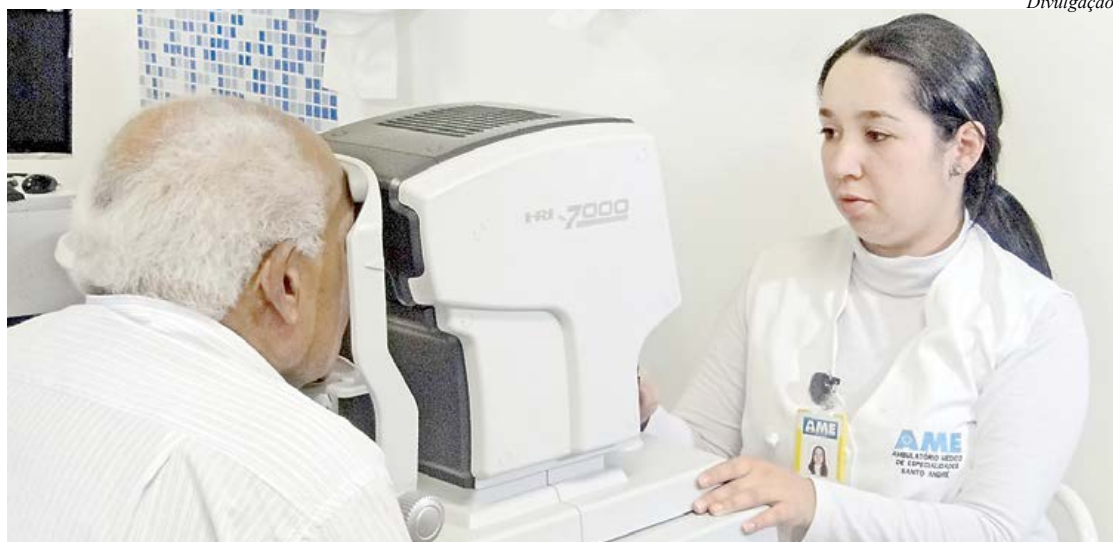
Unidade passou por reestruturação e atingiu objetivos

Unidade tem parceria entre Fundação do ABC e Governo do Estado