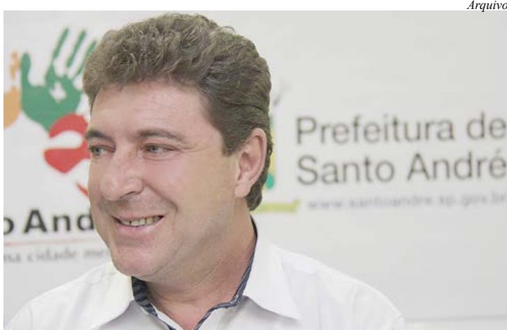
Prefeito Carlos Grana enviou 1º escalão à Câmara

A Prefeitura de Santo André enviou na quinta-feira (8) o primeiro escalão à Câmara de Vereadores para explicar a necessidade de aprovação emergencial do projeto de lei que autoriza o governo a buscar recursos para a criação do Parque Tecnológico da cidade. Os parlamentares entenderam a importância da proposta para o desenvolvimento local e definiram que farão esforço para a votar a matéria em sessão extraordinária, que deve ser realizada na próxima terça-feira (13).