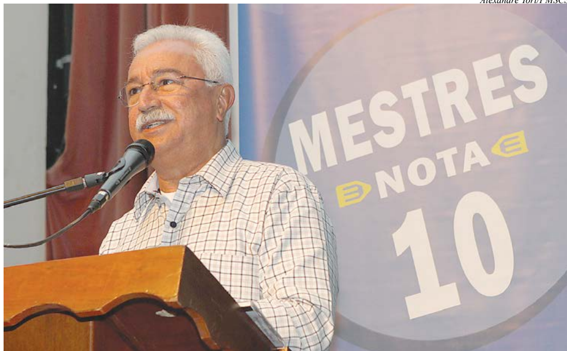
Prefeito propôs aumento de até 100% no abono dos educadores de São Caetano