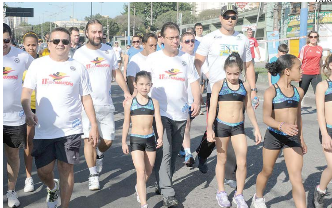
Meia Maratona de São Bernardo abriu as festividades de aniversário da cidade

Mais de seis mil pessoas participaram da 11ª Meia Maratona de São Bernardo do Campo, realizada domingo (4). Já tradicional no calendário esportivo da cidade, o evento faz parte das comemorações pelos 460 anos do município, festejado no dia 20 de agosto.