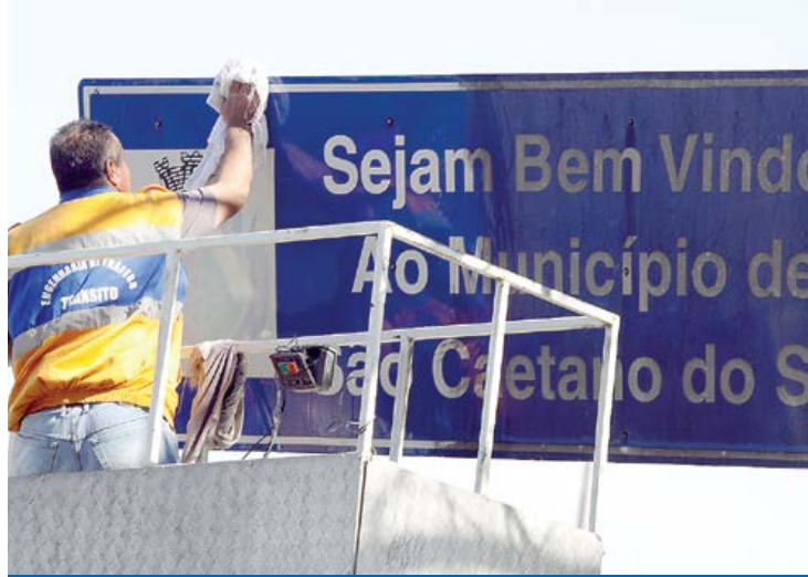
Ação auxilia motoristas e pedestres

A Secretaria de Mobilidade Urbana deu prosseguimento à programação de limpeza das placas de trânsito da cidade. A operação tem o objetivo de facilitar a identificação dos instrumentos por motoristas e pedestres, contribuindo para o aumento da segurança nas vias.