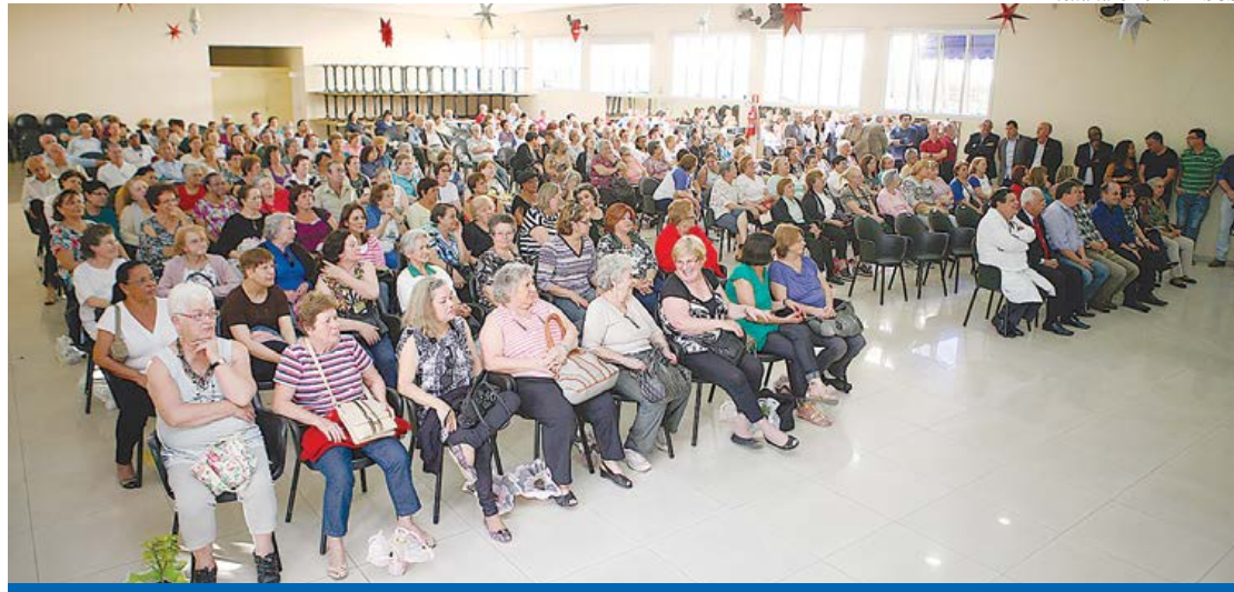
Novos 150 agentes foram convocados. Nas próximas semanas, 250 serão chamados

O Programa Agente Cidadão Sênior recepcionou o primeiro grupo de colaboradores que participará pela primeira vez da iniciativa. Estiveram presentes na cerimônia, realizada no Centro Integrado de Saúde e Educação (CISE) da Terceira Idade Moacyr Rodrigues, 150 novos membros da melhor idade, autoridades e familiares. Durante o evento, o prefeito