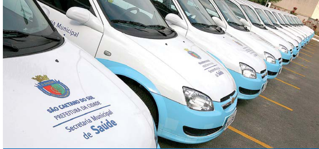
Programa ganha veículos para melhorar o atendimento à população

A partir da semana que vem, os moradores serão ainda melhores assistidos pelo pessoal do Programa Saúde da Família (PSF) da Secretaria de Saúde da Prefeitura. É que na sexta-feira (16/8), às 11 horas, em cerimônia que está marcada para ocorrer em frente ao prédio da Câmara Municipal (Avenida Goiás, 600, Centro), o Governo entregará 15 veículos ao PSF, para que os