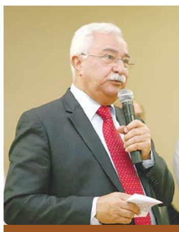
Prefeito discursou no evento

A Associação Beneficente Recreativa Esportiva de Vila Barcelona, tradicional clube da cidade de São Caetano do Sul, completou sua 4ª década de existência. E para celebrar a data, a diretoria do clube organizou uma festividade na sexta-feira (2/8), no Centro Integrado de Saúde e Educação (CISE) da Terceira Idade João Castaldelli, no Bairro Olímpico, com presença do prefeito Paulo Pinheiro, autoridades municipais e dezenas de desportistas do município.