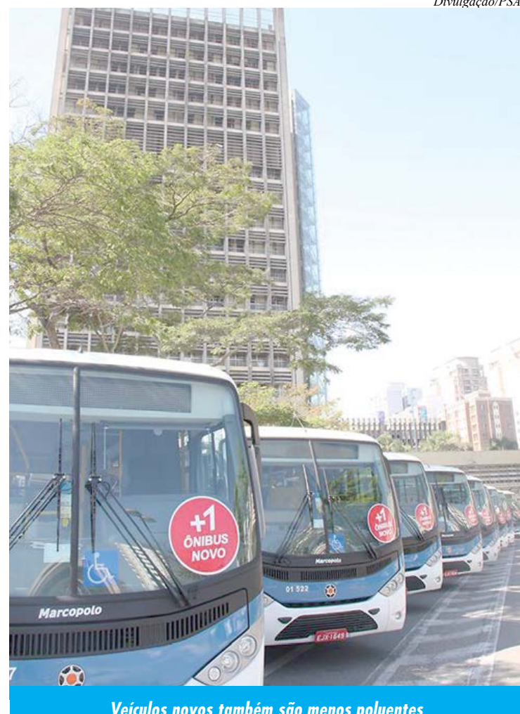
Veículos novos também são menos poluentes