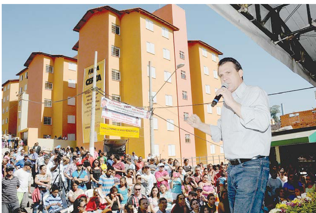
“Todo esse projeto habitacional tem como principal objetivo transformar a vida das pessoas”, afirma o prefeito