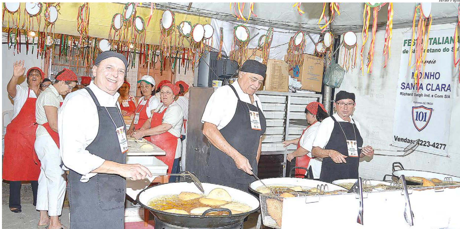
Barraca dos Franciscanos tem a deliciosa Fogazza como atração

Evento integra o Calendário de Festejos pelos 136 anos da cidade