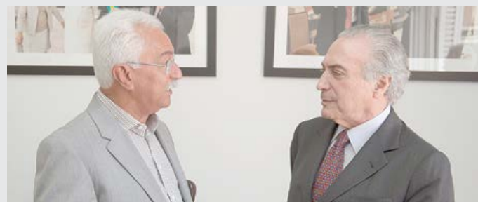
Michel Temer deve vir a São Caetano do Sul

O PMDB estadual vai realizar, no próximo dia 23, o Congresso Regional de Vereadores e Lideranças em São Caetano do Sul. Em local ainda não definido, estão confirmadas as presenças do deputado estadual e presidente estadual da sigla, Baleia Rossi, presidente da Fiesp, Paulo Skaf, deputados e militantes. O vice-presidente da República e presidente nacional do PMDB, Michel Temer ficou de confirmar presença.