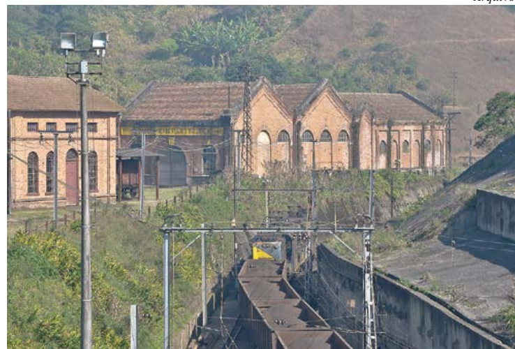
Vila de Paranapiacaba é patrimônio histórico nacional

A Vila ferroviária de Paranapiacaba terá R$ 42,4 milhões do PAC (Programa de Aceleração do Crescimento) – Cidades Históricas para investir na restauração de toda a Parte Baixa. O anúncio foi feito pela presidente Dilma Rousseff na terça-feira (20), na cidade mineira de São João Del Rei. Página 6