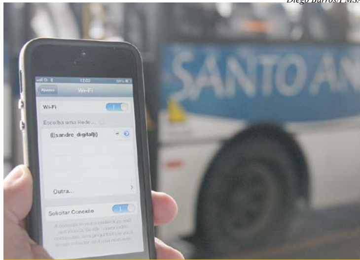
Usuários podem navegar gratuitamente até 100 megabites de downloads

O programa Cidade Digital, iniciativa da Prefeitura de Santo André que garante internet gratuita, ampliou o sinal de Wi-Fi em alta velocidade em outros dois pontos da cidade. Agora, além do terminal de ônibus da Vila Luzita, que disponibiliza o sistema de navegação sem fio desde abril, a Vila de Paranapiacaba e o saguão do Teatro Municipal também contam com a tecnologia.