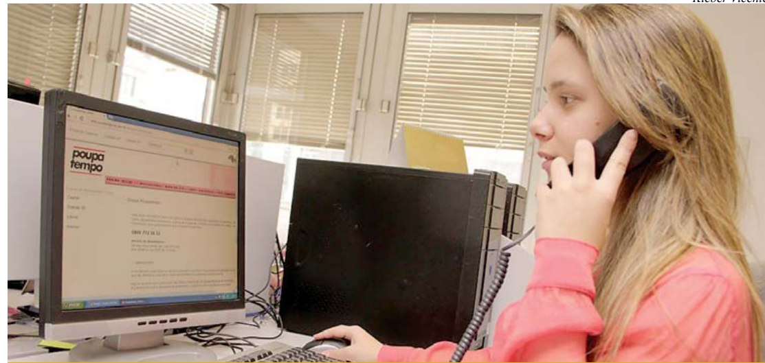
Além da internet, telefone é mais uma alternativa para o cidadão

O Poupatempo está ampliando o agendamento de serviços em sua central telefônica de atendimento. Solicitações ligadas ao RG, que antes poderiam ser agendadas pelo telefone somente em postos da capital, Guarulhos, Osasco e Santos, desde o início do mês estão sendo expandidas para todo o estado.