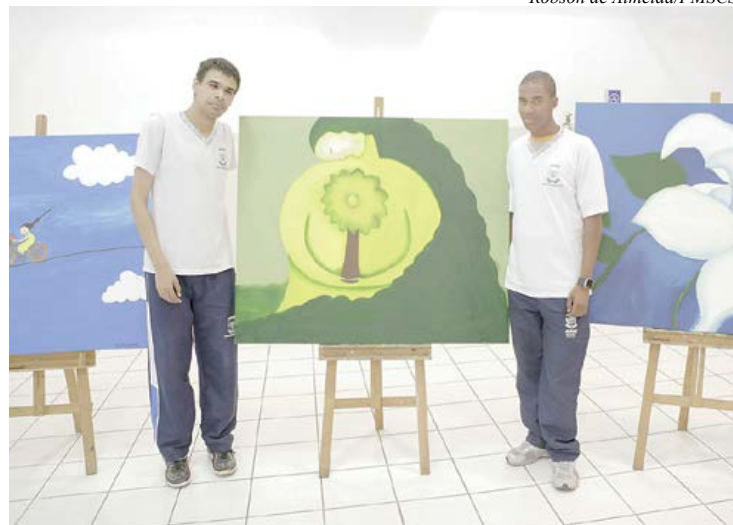
Exposição traz obras dos alunos da Apae de São Caetano

Diversos trabalhos realizados por alunos da Associação de Pais e Amigos dos Excepcionais (Apae) de São Caetano do Sul estão expostos no Espaço Cultural do Atende Fácil, localizado na Rua Major Carlo Del Prete, 651, Centro. A mostra fica aberta ao público até o dia 31 de agosto, de segunda a sexta-feira, das 8 às 18 horas, e aos sábados, das 8 às 12 horas. A entrada é gratuita.