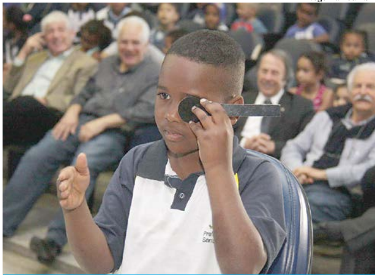
Aluno realiza teste de acuidade visual