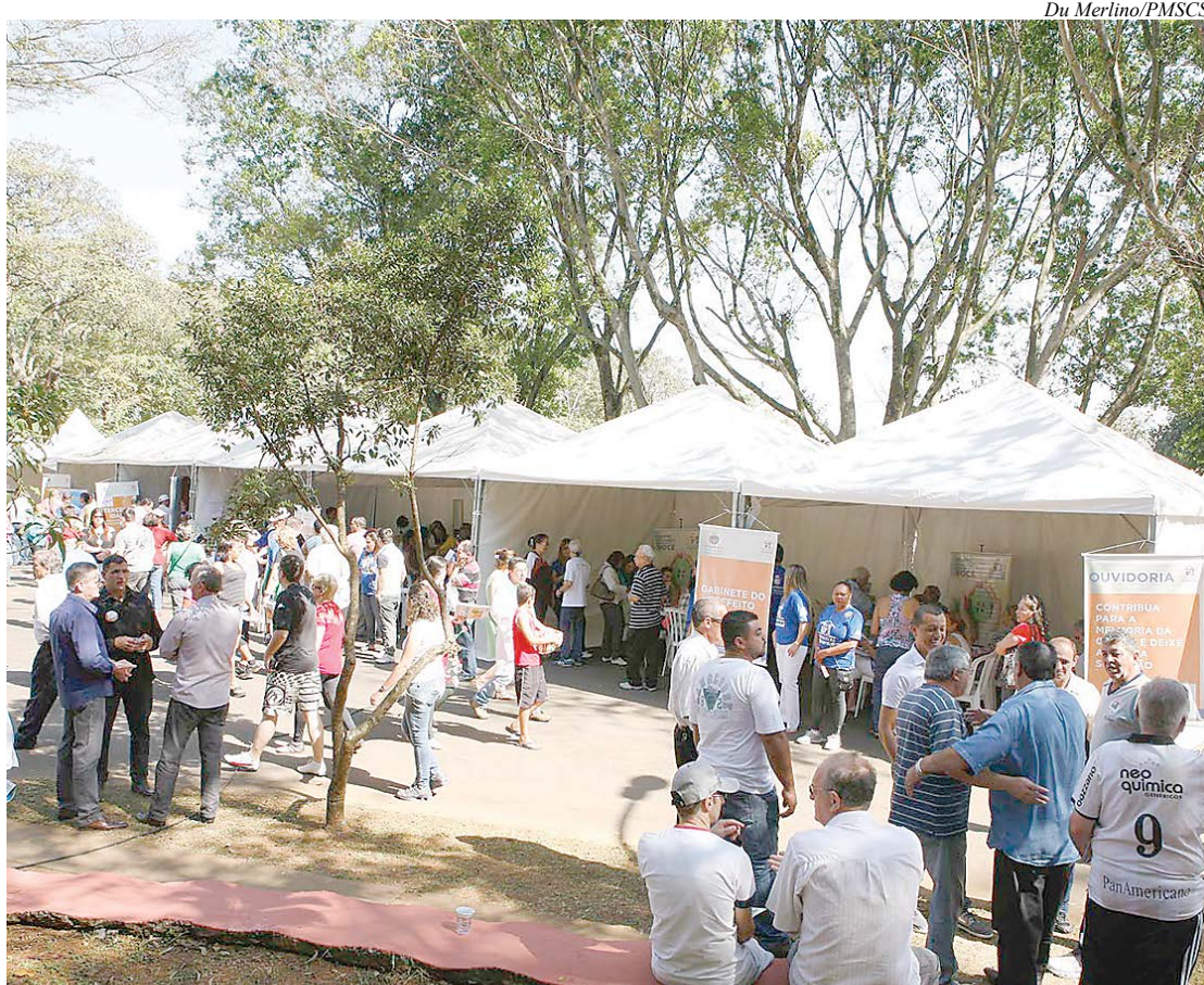
Moradores têm diversos serviços oferecidos pela Prefeitura no mesmo local

Como não poderia faltar, a Secretaria de Segurança realizará apresentações com os cães e os fantoques da Guarda Civil Municipal (GCM).