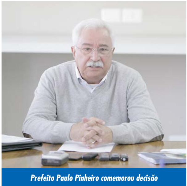
Prefeito Paulo Pinheiro comemorou decisão