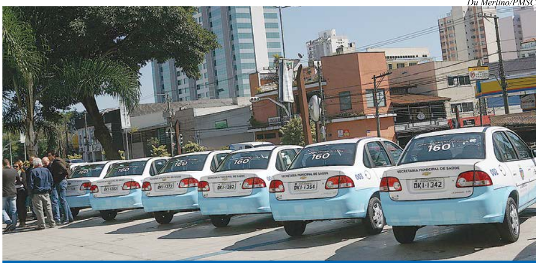
Viaturas entregues já estão nas ruas para atendimento

A Prefeitura de São Caetano do Sul entregou dia 16, em cerimônia na Praça dos Estudantes, diante do prédio da Câmara Municipal, 15 veículos novos para o Programa Saúde da Família (PSF) da Secretaria de Saúde. Os automóveis serão utilizados pelas 23 equipes que percorrem os 15 bairros da cidade, atendendo moradores em suas residências - cada equipe de profissionais do PSF conta com médico, enfermeira, auxiliar de enfermagem e agentes de saúde.