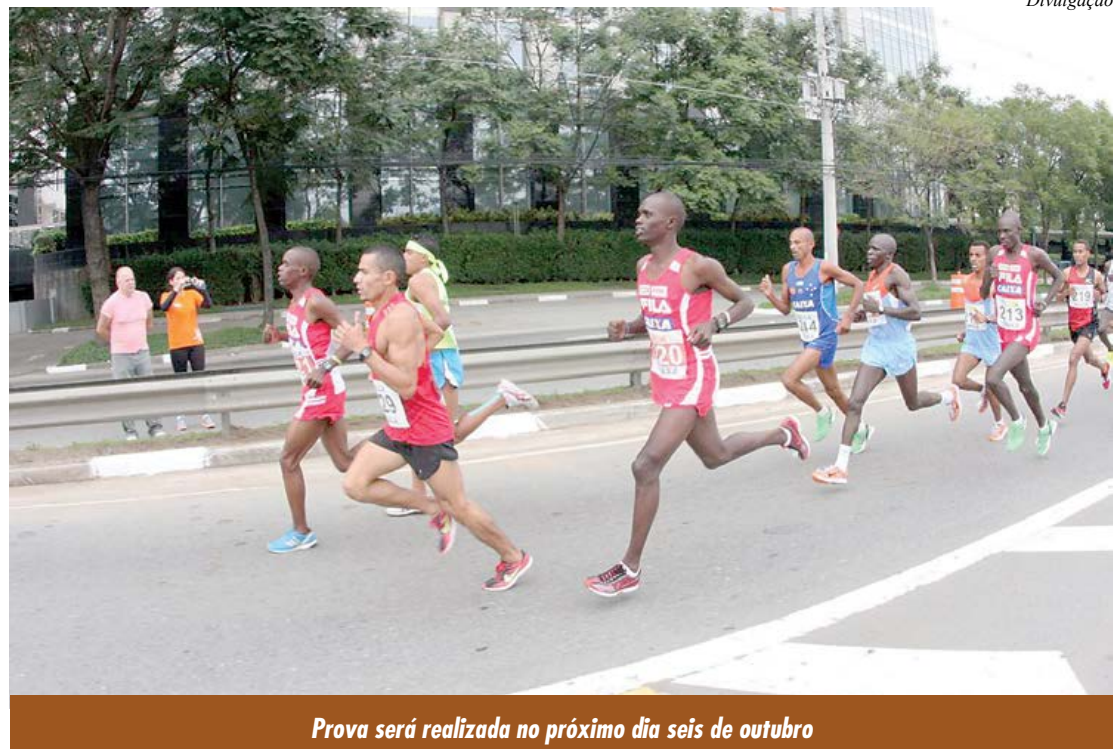
Prova será realizada no próximo dia seis de outubro

Participar de uma maratona é sempre um desafio. Afinal, os 42.195 metros da prova mais famosa do mundo não são para novatos, exigindo, no mínimo, um bom preparo. Na Maratona Internacional de São Paulo, que no dia 6 de outubro completará sua 19ª edição, há a possibilidade de participar do evento enfrentando distâncias menores e adequadas aos vários níveis de competidores. A prova terá ainda provas de 25 km, 10 km e ainda uma caminhada de 3 km,