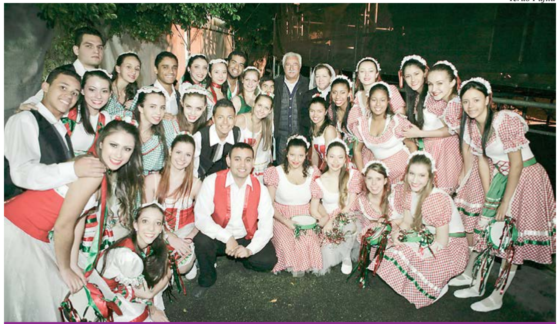
Apresentação - Bailarinas da Escola Municipal de Bailado Laura Thomé e Escola de Ballet Sandra Amaral

A 21ª Festa Italiana chega ao seu final no próximo fim de semana. Além de desfrutar das delícias gastronômicas típicas do país europeu, o público poderá acompanhar atrações musicais diversas. No sábado (24/5), apresentam-se a Banda Italianíssima Brasil e as bailarinas da Escola Municipal de Bailado Laura Thomé e da Escola de Ballet Sandra Amaral.