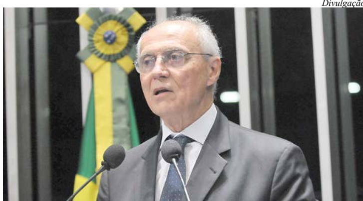
Senador estará em Santo André

A Casa da Palavra fica na Praça do Carmo, 171, Centro. Mais informações no telefone: 4992-7218. As atividades são abertas ao público.