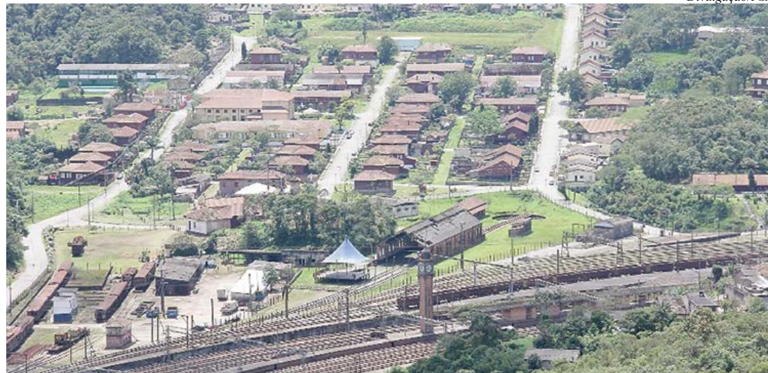
Vila de Paranapiacaba, patrimônio histórico nacional, terá R$ 42,4 milhões do PAC

A Vila ferroviária de Paranapiacaba terá R$ 42,4 milhões do PAC (Programa de Aceleração do Crescimento) – Cidades Históricas para investir na restauração de toda a Parte Baixa. O anúncio foi feito pela presidente Dilma Rousseff na terça-feira (20), na cidade mineira de São João Del Rei. Na segunda-feira (19), a cidade já havia conquistado R$ 449 milhões do PAC para melhorias em mobilidade urbana e habitação.