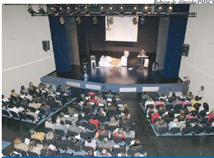
Grupo teatral apresenta cena O Cuidador e o Paciente Idoso

No sábado (17/8), a Secretaria de Saúde de São Caetano do Sul, por meio do Programa Melhor em Casa - Serviço de Atendimento Domiciliar, realizou o I Encontro de Cuidadores da cidade. Com a capacidade máxima do Teatro Santos Dumont preenchida, a iniciativa debateu o papel do cuidador, agregando informações e entretenimento ao público.