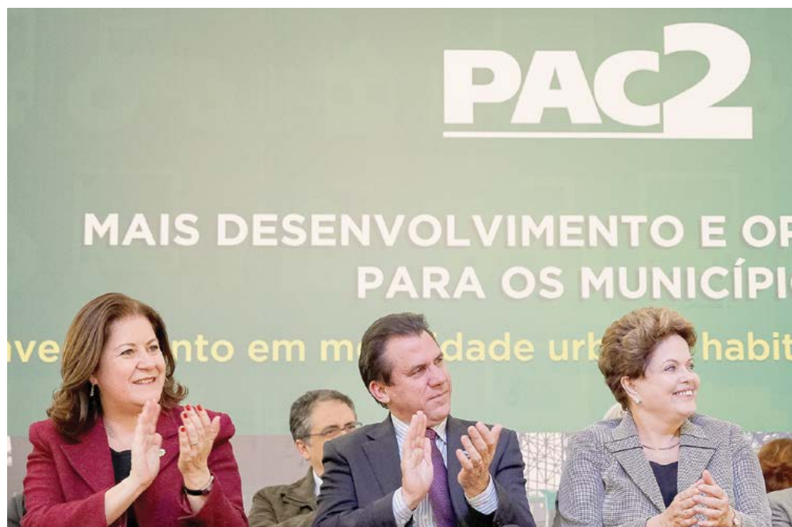
Ministra Miriam Belchior, prefeito Luiz Marinho e presidenta Dilma Rousseff

Em seu discurso, Dilma destacou a importância do Consórcio formado pelos sete municípios. “Em áreas com essa característica de interligação, de interconexão, onde não se tem noção dos limites, é muito mais racional fazer obras conjuntas. Hoje vocês dão um padrão diferenciado