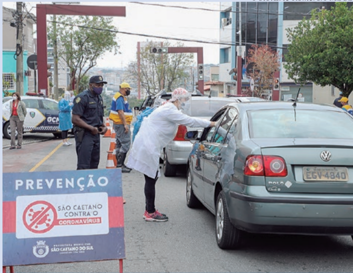
Ação teve início no Bairro Barcelona

A população de São Caetano do Sul aprovou mais uma ação pioneira da cidade no combate à disseminação do coronavírus. Iniciada na quinta-feira (14/5), a testagem de motoristas e passageiros contra a covid-19 em bloqueios