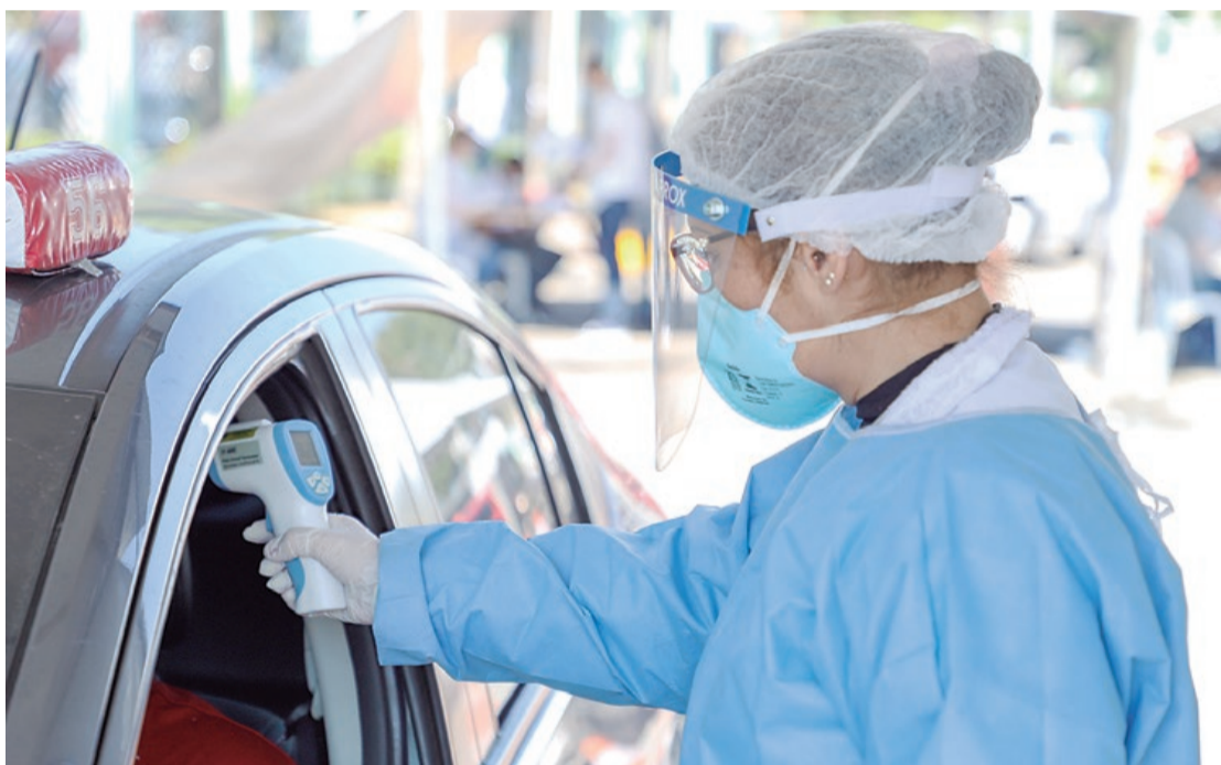
São Caetano do Sul ultrapassou a marca de 10 mil testes rápidos no Drive Thru

sobre as razões da saída. Havia divergências entre ele e o presidente Jair Bolsonaro sobre temas como o distanciamento social e o uso da cloroquina para o tratamento da covid-19. Ele agradeceu à sua equipe, que “sempre o apoiou”, e destacou a importância do trabalho conjunto do governo federal com os conselhos de secretários estaduais e municipais de Saúde.