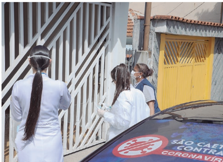
Coleta de exame em casa através do Disk Coronavírus

“Temos trabalhado incansavelmente para enfrentar a pandemia e superar as dificuldades. Cada morador importa para nós. Não reduziremos ninguém a uma estatística. Por isso, não medimos esforços para fazer o melhor que podemos, apoiando os munícipes seja em tratamento médico, seja com alimentos, testes e também gratificações aos profissionais da Saúde que estão na linha de frente. Nosso objetivo maior é salvar vidas”, afirma o prefeito José Auricchio