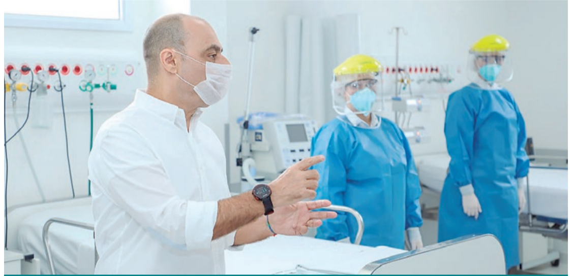
Procurador-geral do TCE citou a cidade como bom exemplo para outros municípios

A Prefeitura de São Caetano tem sido referência de atuação no enfrentamento ao coronavírus. Além das ações de Saúde, a transparência em relação às informações também é destaque. Nesta semana, o Boletim Covid-19 da cidade passou a disponibilizar ainda mais informações e chegou a receber elogios em órgãos estaduais de controle.