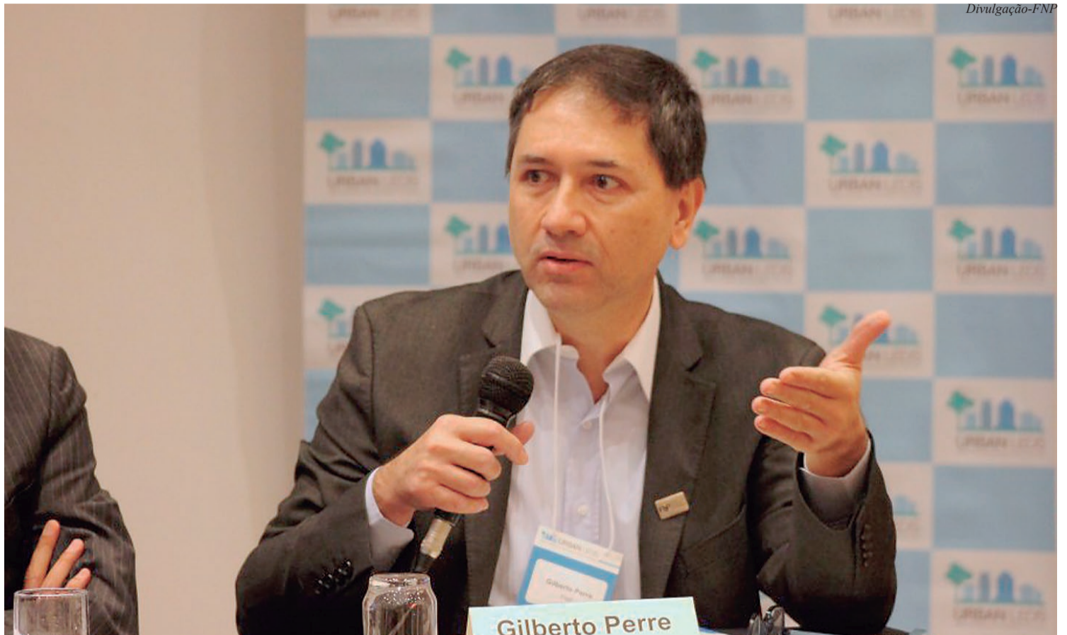
Gilberto Perre é presidente da Frente Nacional de Prefeitos

A atual crise sem precedentes nos últimos 100 anos provocada pela pandemia de covid-19 exige gestão eficiente, profissional, competente e com líderes públicos experientes, para lidar com as dificuldades administrativas e financeiras das cidades. Ou seja, não é para amadores fazer com que os municípios passem bem pelo atual momento e também retomem com o desenvolvimento necessário o pós-pandemia.