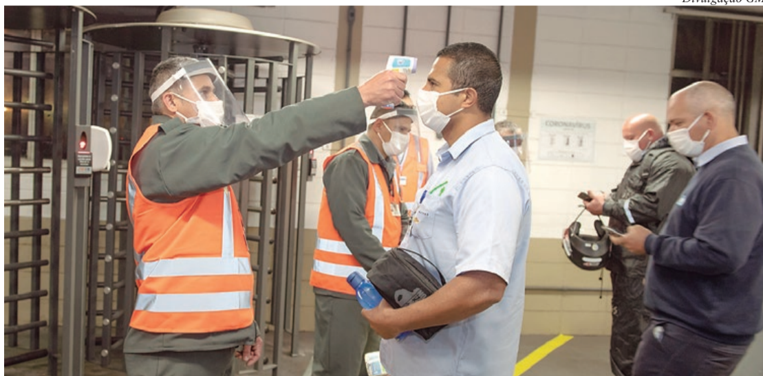
Reinício gradual terá rígido protocolo de segurança para o novo coronavírus