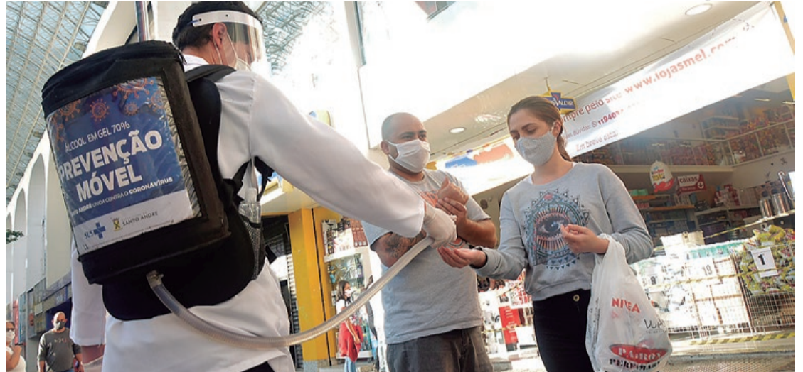
Ação higieniza mãos da população e distribui máscaras laváveis

PIT STOP E MÁSCARAS – As ações de prevenção móvel são uma extensão dos Pit Stops da Prevenção, que foram instalados em terminais de ônibus e feiras livres de Santo André. Nestes locais,