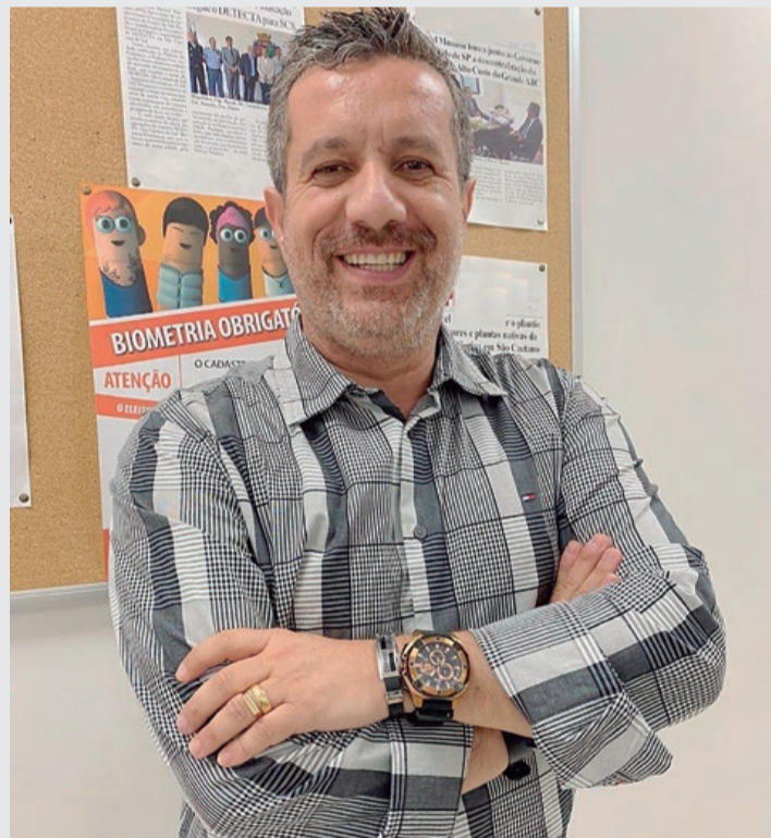
Vereador encaminhou indicação ao Executivo

“Há grande importância na continuidade das ativi-