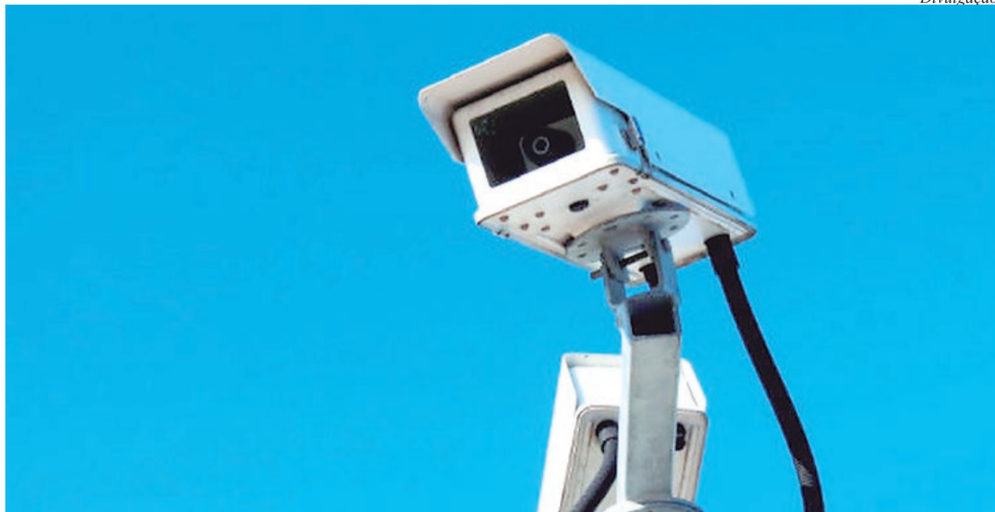
Aparelho validado recebe certificado válido por um ano

O Ipem-SP (Instituto de Pesos e Medidas do Estado de São Paulo), autarquia do Governo do Estado, validou nesta quinta-feira, 4 de junho, os radares instalados na Rua Ana Neri, próximo da Alameda México, em Santo André, na sequência, na Avenida Guido Aliberti próximo da Avenida Bartolomeu Bueno da Silva, em São Caetano do Sul, no ABC paulista.