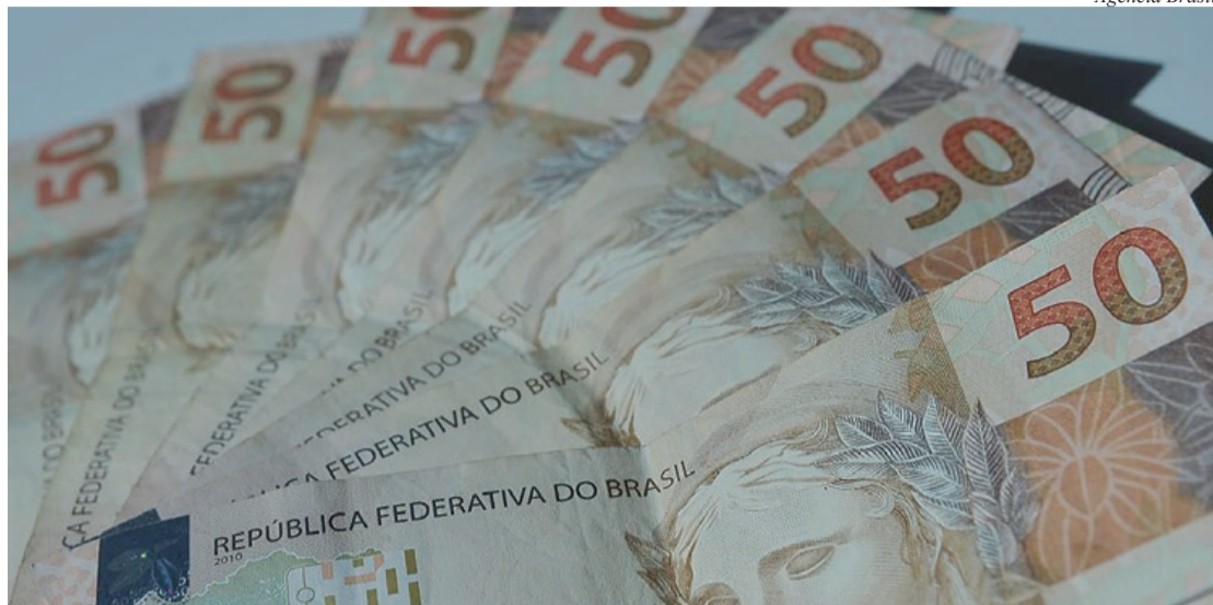
Valor será menor que os atuais R$600

tecipou um possível aumento no valor do benefício do Bolsa Família, pago a cerca de 14 milhões de famílias em situação de pobreza e pobreza extrema. O valor do eventual