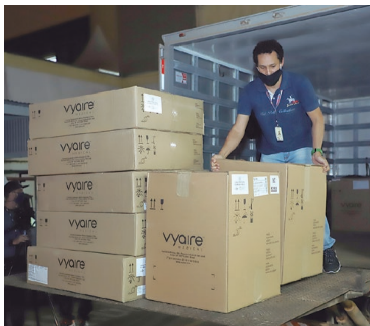
Aparelhos colaboram no aumento de leitos

O governo do Estado entregou dez respiradores à Prefeitura de São Caetano do Sul na noite de quinta-feira (4/6). Os aparelhos, solicitados pela municipalidade ao Ministério da Saúde em abril, permitirão a adaptação de mais dez leitos de baixa e média complexidades em UTIs (Unidades de Terapia Intensiva), conforme a necessidade que se apresentar durante a pandemia do coronavírus.