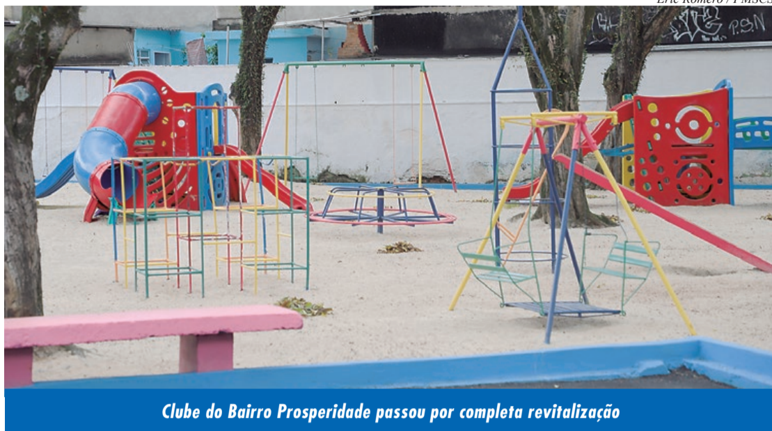
Clube do Bairro Prosperidade passou por completa revitalização

Cespro é um ganho para toda a comunidade do bairro, que ganha um espaço totalmente novo, inclusive com áreas que não existiam no clube, como a quadra de futebol de areia, por