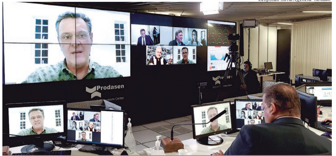
Senador Carlos Fávaro (PSD-MT) em pronunciamento via videoconferência

Os recursos devem ser aplicados exclusivamente para atendimento à população idosa e devem ir de preferência para ações de prevenção e de controle da covid-19, compra de insumos e de equipamentos básicos para segurança e higiene dos residentes e funcionários, compra de medicamentos e adequação dos espaços para isolamento dos casos