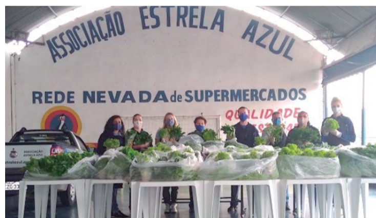
ONG Estrela Azul, de Mauá, colaborou com a distribuição

dutores rurais, que respondem por cerca de 25% do abastecimento nacional de verduras e até 90% do que é consumido na capital paulista.