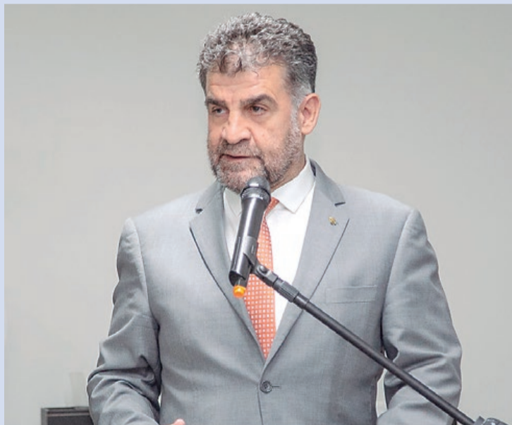
Parra: "Temos a convicção que conseguiremos superar esse difícil momento com Tecnologia e Inovação"

Por meio de propostas sugeridas por seu mandato legislativo, como forma de criar alternativas para empreendedores, a Prefeitura atendeu a diversas iniciativas. Entre elas, a parceria com a startup Olist. Microempreendedores, pequenas empresas, autônomos, profissionais liberais e artesãos podem ter sua própria vitrine virtual de forma gratuita no aplicativo. O cadastro está disponível na plataforma on-line Olist Shops. Acesse www.olistshops.com