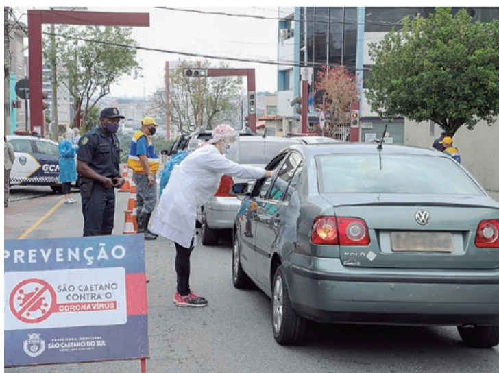
Equipe de saúde mede a temperatura nos bloqueios de trânsito

Até o fechamento desta edição, 62 pacientes estavam internados em hospitais municipais, 31 na rede privada e 16 em outras cidades.