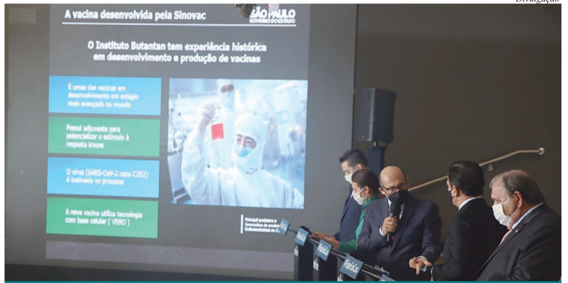
Anúncio foi feito durante coletiva de imprensa no Palácio dos Bandeirantes

Se a vacina for aprovada, a Sinovac e o Butantan vão firmar acordo de transferência de tecnologia para produção em escala industrial tanto na China como