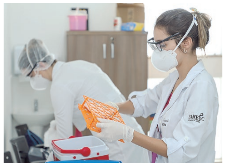
Já foram realizados 3874 exames domiciliares