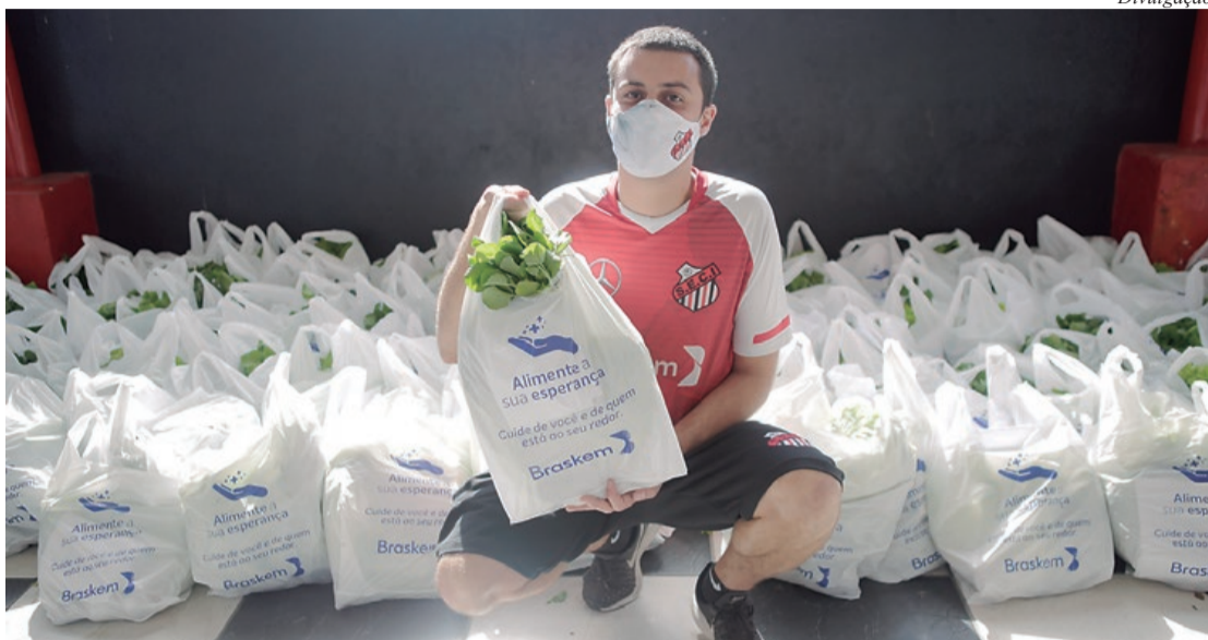
Distribuição de verduras no Instituto Seci Social foi realizada no domingo (7/6)

Para a distribuição, a Braskem conta com o apoio de instituições locais. No sábado (6/6), a ONG Estrela Azul, em Mauá, iniciou a ação. Já no domingo (7/6), foi a vez do Seci Social, em Santo André. Nos próximos dias, o intermédio das doações será