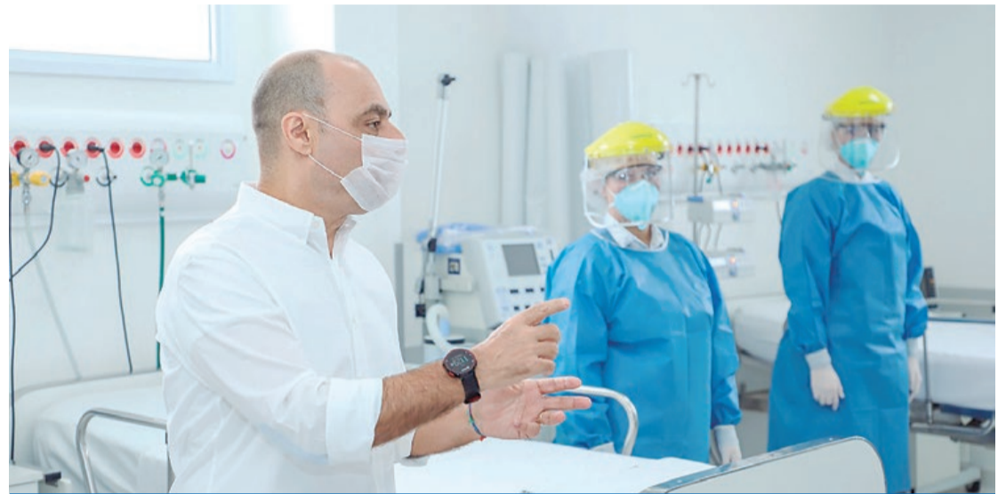
Prefeito Auricchio implantou diversos serviços para atender pacientes com a covid-19

AVANÇOS - Das 40 unidades médicas municipais de São Caetano - entre hospitais, UBSs e centros de especialidades (como oftalmológica, odontológica, de saúde da mulher, entre outras), 23 foram inauguradas nas gestões de Auricchio. Ou seja, mais do que os 10 outros prefeitos de