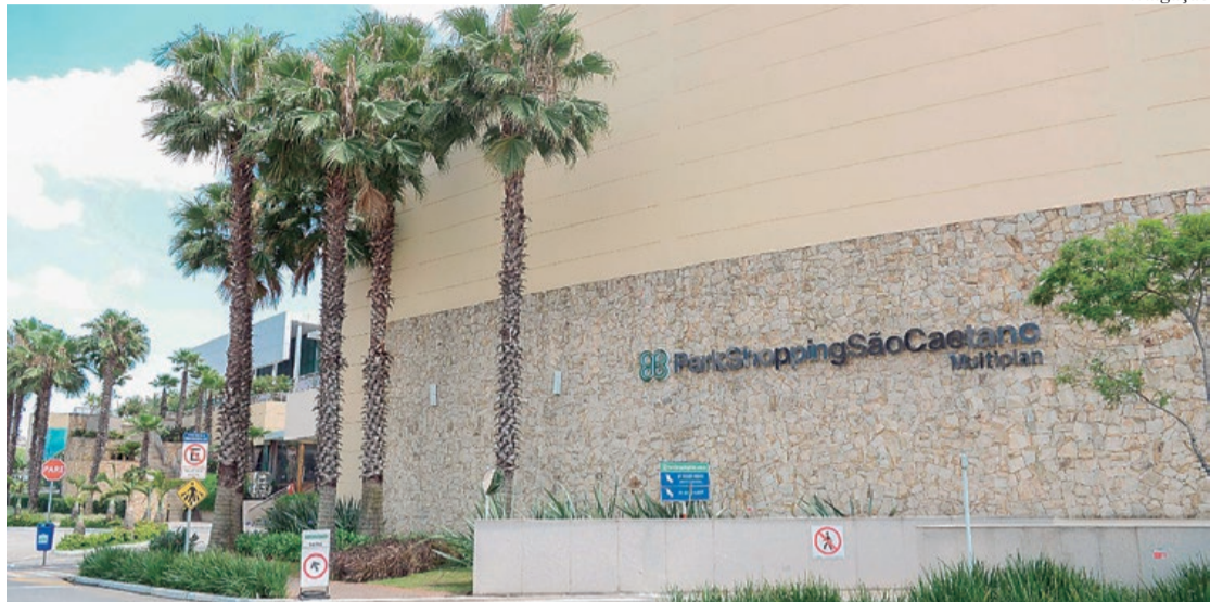
O horário de funcionamento será reduzido, das 16h às 20h

O protocolo de segurança desenvolvido pela Multiplan se enquadra nas medidas propostas a todos os shoppings pela Abrasce, que teve o seu protocolo validado pelo Hospital Sírio Libanês. Foi adotada uma intensa rotina de assepsia em todas as dependências, aferição de temperatura nas entradas dos shoppings, uso obrigatório de máscaras para todos e ampliação de pontos com dispensadores de álcool em gel.