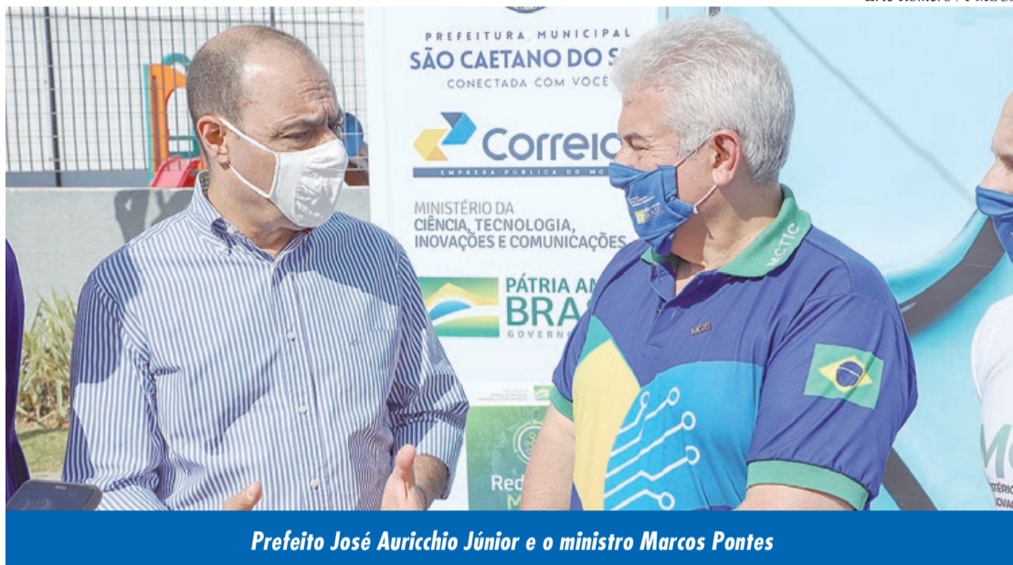
Prefeito José Auricchio Júnior e o ministro Marcos Pontes

O prefeito Auricchio agradeceu a presença do ministro e a escolha do município para participar do programa. "Em São Caetano, temos promovido todas as medidas necessárias para enfrentar o vírus, seja em prevenção ou no tratamento da doença. Temos