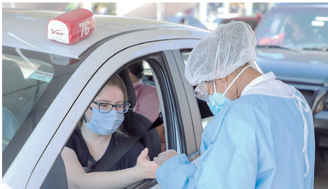
Cidade é referência no tratamento do novo coronavírus