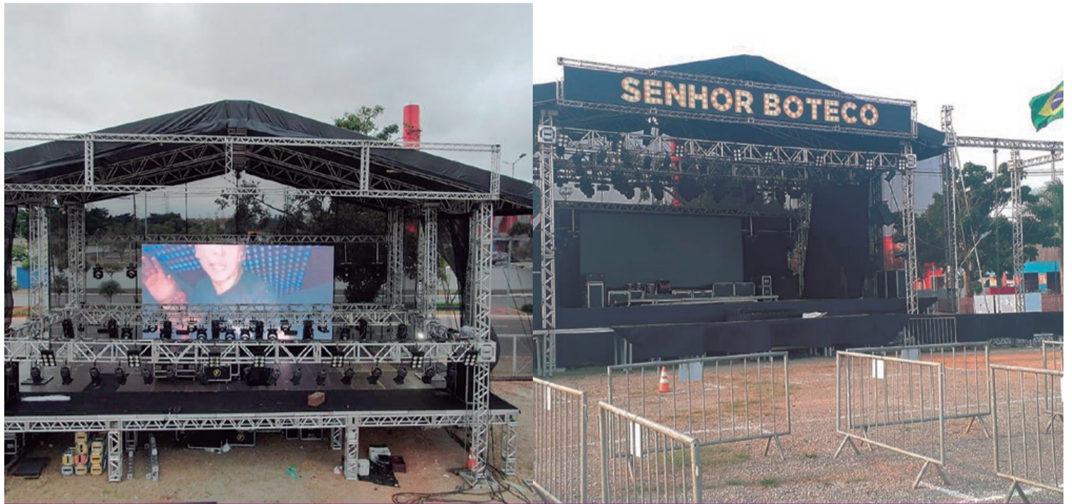
Ampla espaço, atrações musicais e gastronomia diversificada dão o tom do Senhor Boteco Drive-in