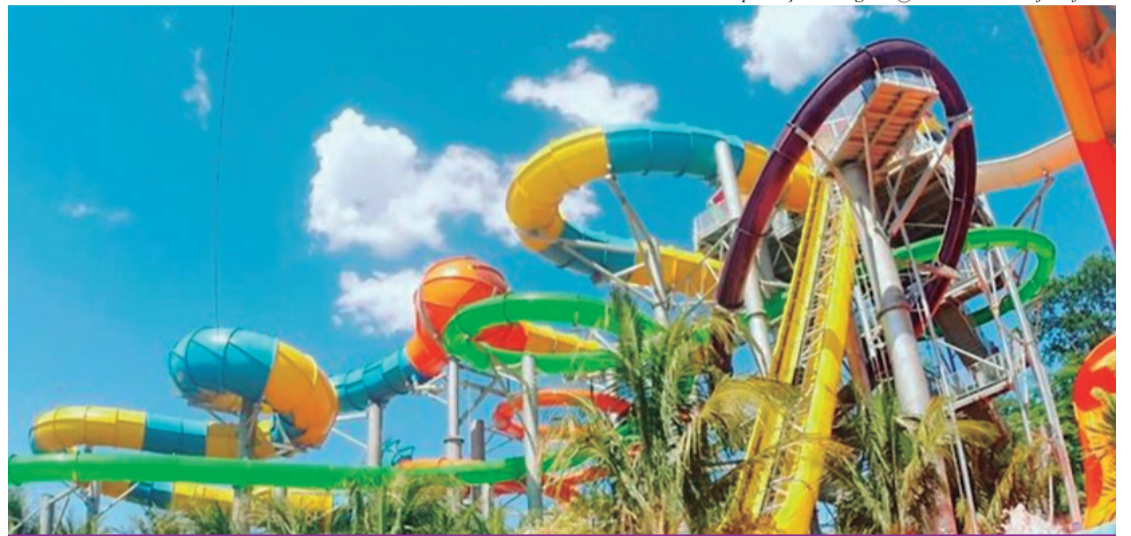
TERMAS DOS LARANJAIS - O complexo de tobogã Lendário inaugurou em março de 2019

"Os protocolos foram acordados com o próprio setor e seguem os mesmos adotados internacionalmente. A reto-