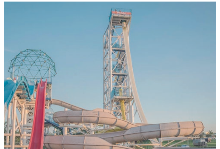
WET'N WILD reabre dia 26/09 com agendamento prévio

Park, de São Pedro, com 641 mil, e o Hot Beach, também de Olímpia, com 608 mil — os três tiveram um crescimento acima de 30% no número de visitantes na comparação entre 2019 e 2018.