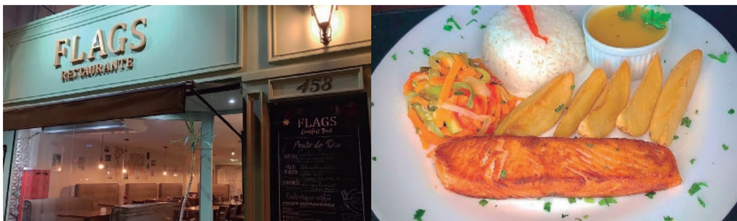
FLAGS - Uma grande diversidade de opções para atender todos os gostos

Uma viagem ao redor do mundo por meio da gastronomia. Essa é a proposta do Flags Restaurante localizado no coração de São Caetano. Em um ambiente temático e muito confortável, a Casa oferece um cardápio com receitas deliciosas que representam as bandeiras de vários países, dentre eles, o tradicional italiano Filet à Parmegiana e o brasileiro São Sebastião, filet de pescada ao molho de camarão com arroz e batata rústica, carro-chefe da Casa.