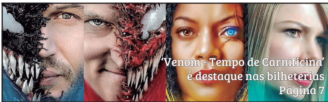
'Venom - Tempo de Carnificina' é destaque nas bilheterias Página 7