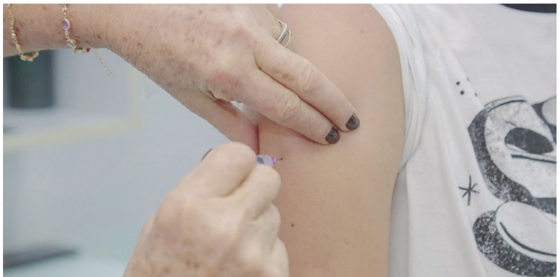
Unidades Básicas de Saúde estarão abertas das 8h às 17h

Desde o início da campanha, compareceram 1.293 crianças e 553 precisaram ser imunizadas nas UBSs do município. “As faixas etárias que mais precisaram atualizar a carteira de vacinação foram as menores de um ano. Compareceram aos postos de vacinação 292 crianças e 165