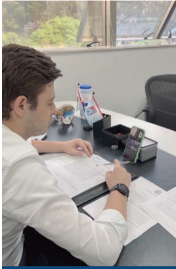
Deputado estadual Thiago Auricchio

A CPI de Ações e Omissões no Combate à Violência contra Mulher da Assembleia Legislativa de São Paulo aprovou, na última quarta-feira (13), requerimentos do relator Thiago Auricchio (PL) que convida representantes do MP-SP, da Defensoria Pública do Estado e da ONU, a detalharem um pouco mais de suas funções e atribuições no combate da violência doméstica no Estado.