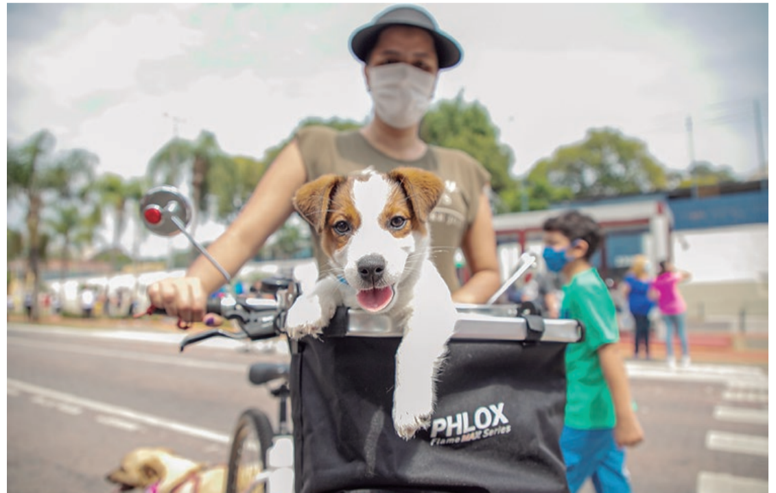
Prefeitura e USCS assinam termo neste domingo; atendimentos começarão em 2022

quatro salas de atendimento para pequenos animais e pets não convencionais, baias para animais de grande porte, dois centros cirúrgicos e consultórios para atender animais de pequeno e grande portes. O espaço terá, ainda, capacidade para 24 atendimentos diários para animais de pequeno porte, equipamentos para exames de imagem, radiologia e de diagnóstico clínico-laboratorial. Tudo de graça.