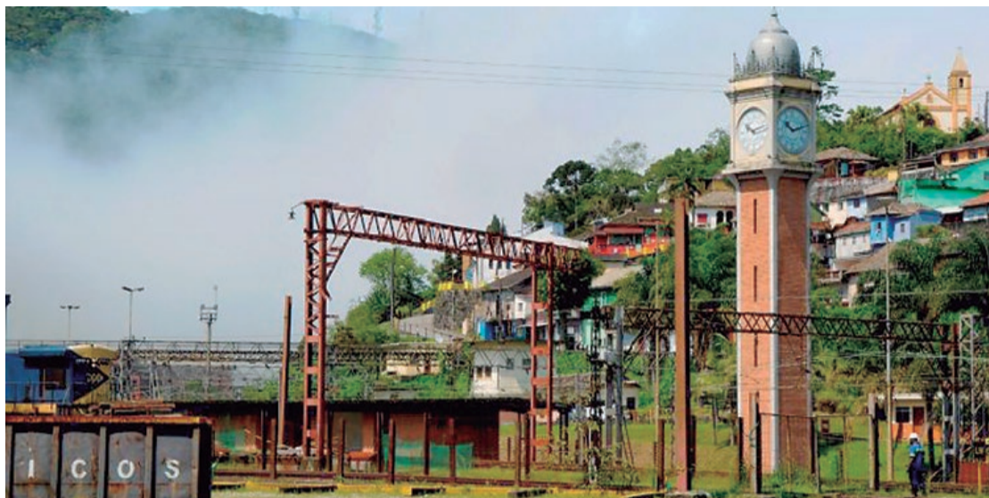
Equipe do IBGE vai entrevistar todos os moradores do Bairro Prosperidade