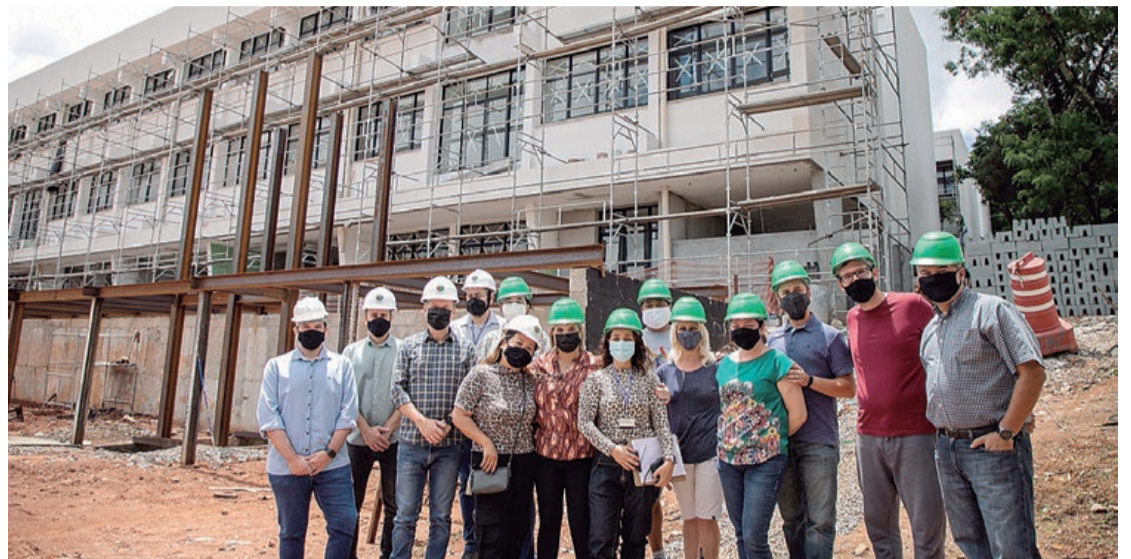
Prefeito esteve acompanhado de representantes da Associação de Pais e Mestres

A unidade de Ensino Fundamental atenderá do 1º ao 5º ano (Fundamental I) em tempo integral e, do 6º ao 9º (Fundamental II), em regime de meio período. “A unidade de Educação Infantil poderá ser em período integral ou meio período, dependendo da demanda do bairro”, infor-