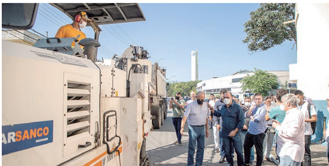
O investimento será de cerca de R$ 6 milhões

No Bairro Prosperidade, são contempladas as ruas dos Cristais, Perite, do Coral, dos Mármore, das Pérolas, dos Berilos, Platina e Rádio. Na sequência o programa estará no Bairro Olímpico, nas ruas Ribeirão Preto (da Rua Piraju até a Avenida Presidente Kennedy), Rio Claro (da Avenida Tijucussu até a Rua Ribeirão Preto) e Francesco de Martini. A previsão é a de que esta etapa esteja concluída até o fim de abril.