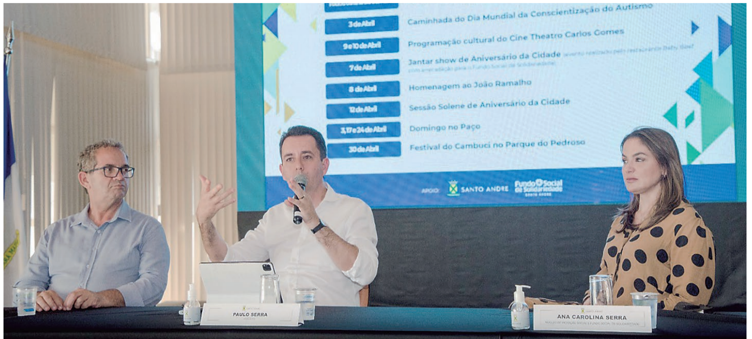
Feira da Fraternidade, atividades de cultura e lazer e entrega de novos equipamentos públicos são alguns dos destaques das comemorações

Santo André comemora 469 anos no dia 8 de abril com uma programação movida a muita solidariedade. Depois de dois anos seguidos de pandemia, a cidade divulgou a agenda de eventos que vai contemplar vários bairros.