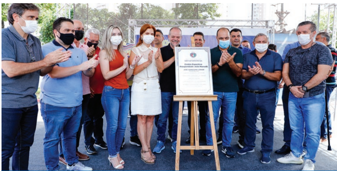
Prefeito, vereadores e secretários durante o descerramento da placa

INICIAÇÃO ESPORTIVA PARA PESSOAS COM DEFICIÊNCIA - No Cespro está sendo realizado o Programa de Iniciação Esportiva para Pessoas com Deficiência, parceria da Prefeitura (secretarias dos Direitos da Pessoa com Deficiência ou Mobilidade Reduzida e