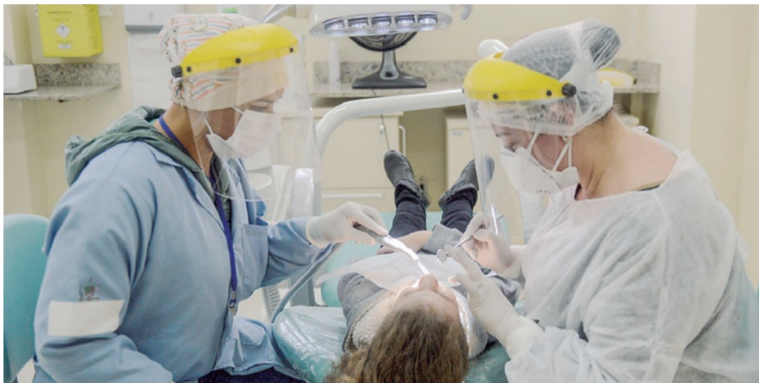
Equipamentos foram instalados nas UBSs do Jardim Ipê e bairro União

UNIDADES CONTEMPLADAS – As unidades escolhidas para a instalação dos novos equipamentos somam, juntas, um total de 3.500 atendimentos de odontologia ao mês. De acordo com o secretário de Saúde, Dr. Geraldo Reple Sobrinho, as novas cadeiras proporcionam mais conforto aos pacientes e