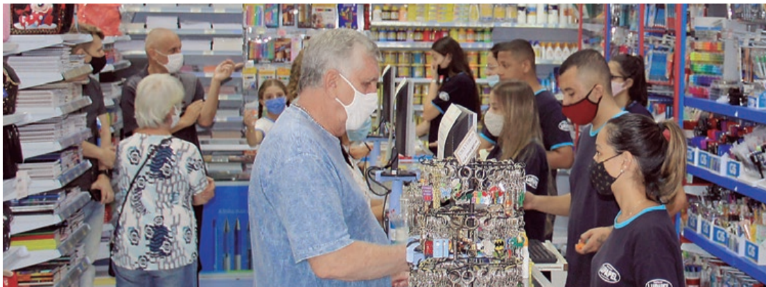
Lupapel foi uma das primeiras papelarias credenciadas

A Papelaria Lupapel fica na Rua Dr. Augusto de Toledo, 902/916, no Bairro Santa Paula, em São Caetano do Sul. Abre de segunda a sexta-feira, das 8h à 18h e, no sábado, das 8h às 14h. Possui estacionamento próprio com 29 vagas e serviço de manobristas (gratuitos). Mais informações: 4229-5011.