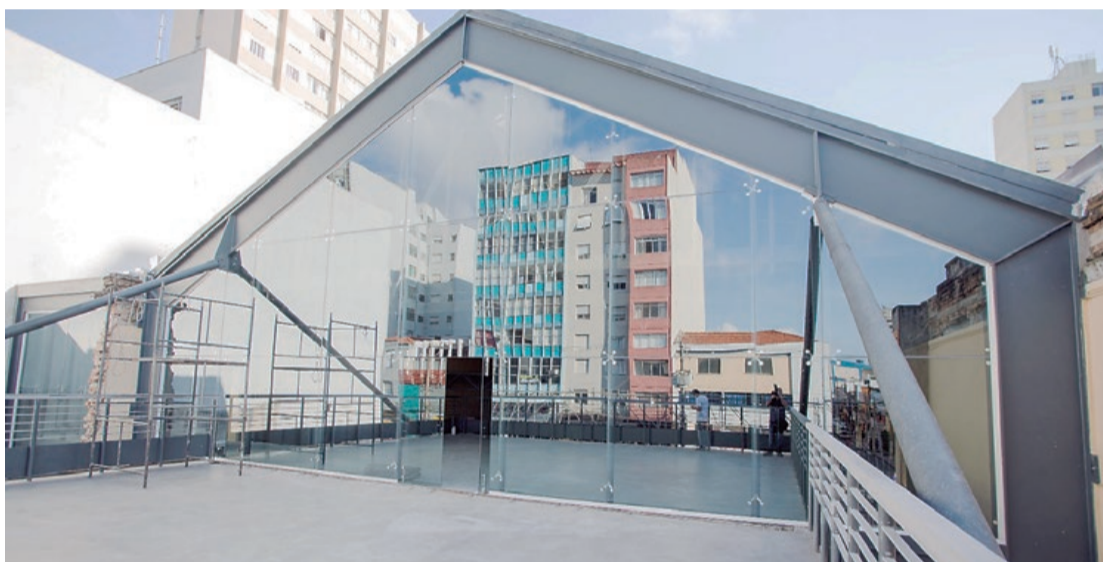
O conceito proposto é da utilização do edifício como uma praça coberta

No domingo (10), o espaço multiuso receberá um Festival Multicultural, das 10h às 17h. A Companhia SiLaBÁ apresenta o musical infantil 'Cadê o Pindó?', às 11h. Às 14h, será realizada mais uma visita monitorada no restaurante da obra. E às 15h, show musical com o músico Allan Spirandelli.