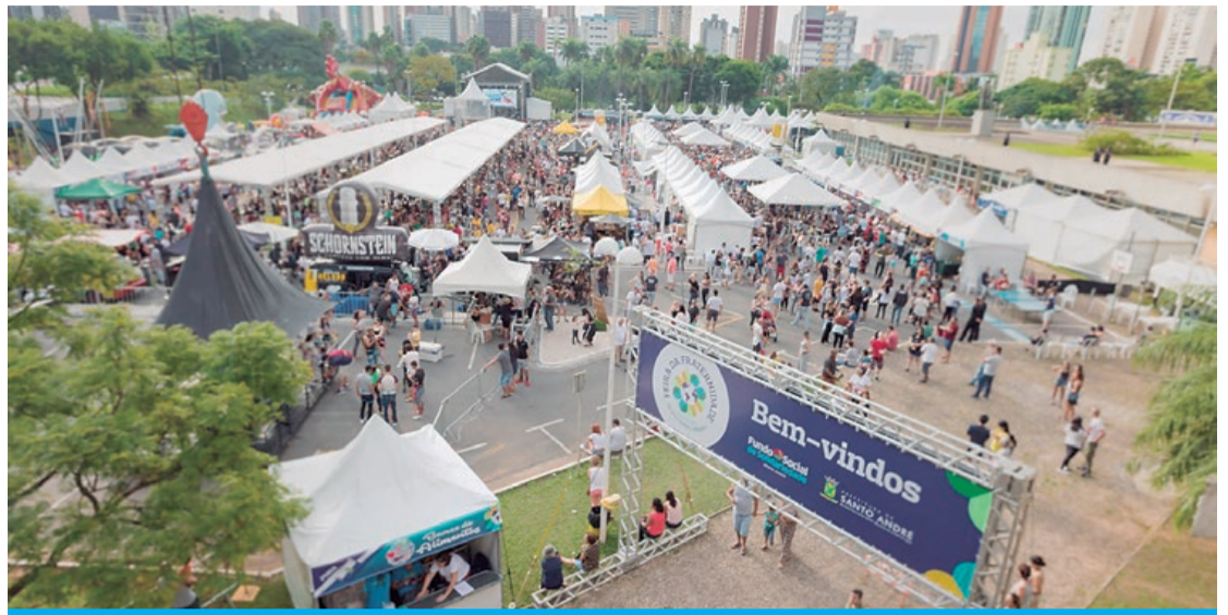
Última edição da Feira da Fraternidade foi realizada em 2019, em virtude da pandemia de Covid-19

Entre os pratos disponíveis, a feira contará com: yakissoba, bolinho japonês, tempurá, hambúrguer artesanal, crepes, buraco quente, pizzas, massas, lanche de