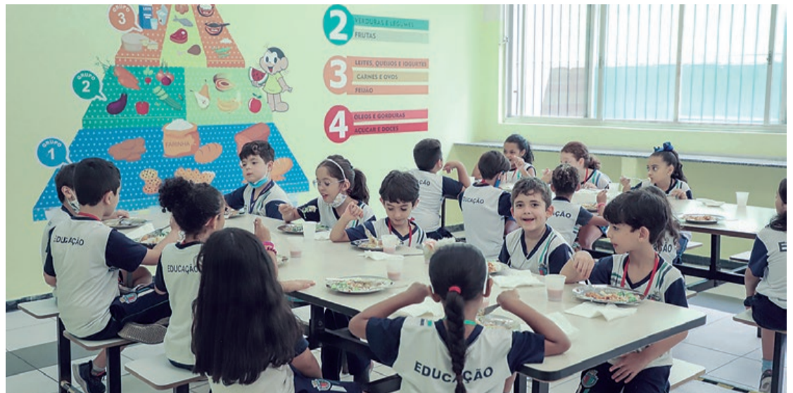
Programa Almoço na Escola permite ao aluno permanecer na escola para acompanhar atividades no contraturno