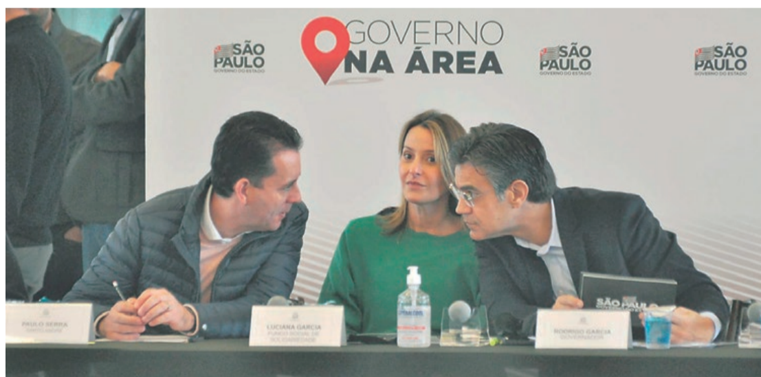
Prefeito Paulo Serra com o governador Rodrigo Garcia

as demandas das cidades e anunciou investimentos em áreas como infraestrutura, educação e habitação, além