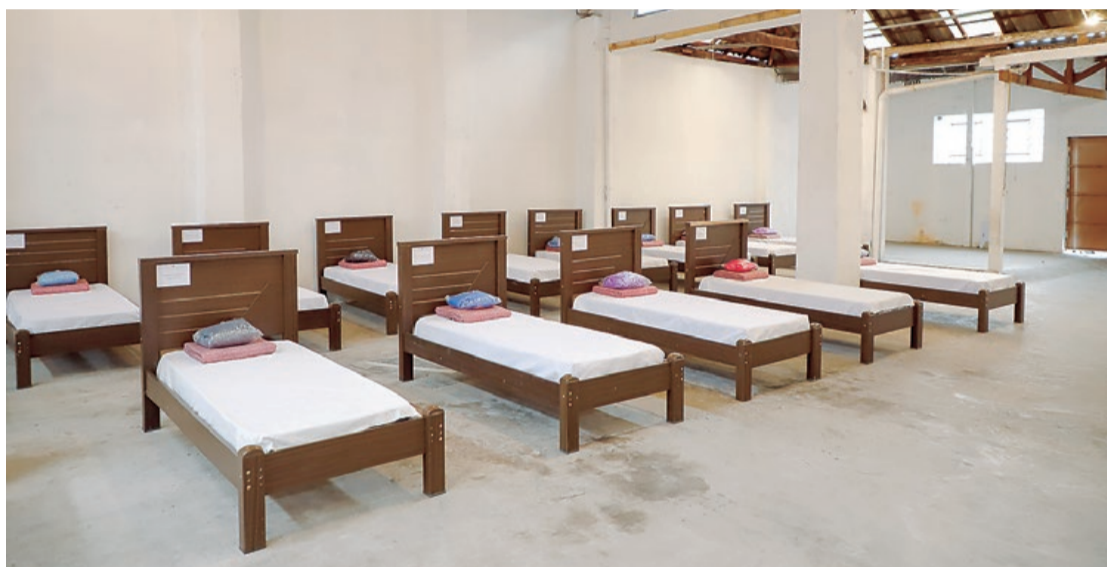
Serão 40 vagas de pernoite, oferecidas quando a temperatura for igual ou inferior a 13 graus

O Abrigo ficará aberto até o dia 20 de setembro, fim do inverno. Os assistidos serão encaminhados pelo Creas (Centro de Referência Especializado de Assistência Social) e/ou pelo serviço de urgência e emergência 156 SOS Cidadão.