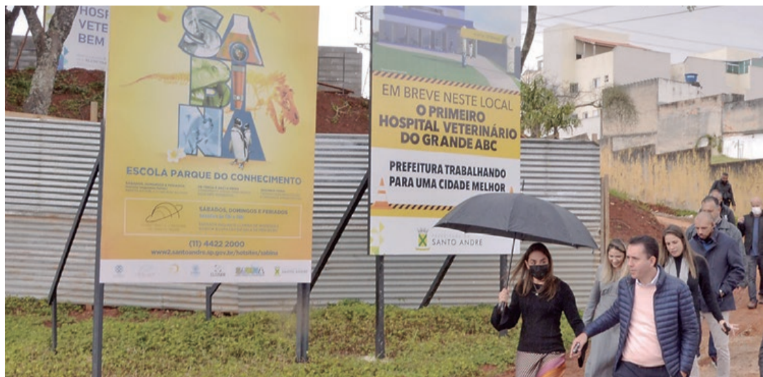
Terão prioridade pets de tutores de baixa renda e vítimas de maus-tratos

O novo hospital contará com duas salas cirúrgicas, quatro consultórios, salas de pré e