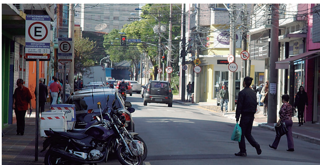
Motoristas também voltam a ganhar a opção de pagamento pelo sistema de talonário

suspende por tempo indeterminado os efeitos de decretos anteriores (nº 11.718, de 15 de outubro de 2021, e nº 11.739, de 16 de dezembro de 2021). Já a venda em papel volta a ser de forma avulsa ou por talão fechado, pelos postos de venda credenciados, identificados com placas específicas e bem visíveis ao público em geral. Pela comercialização dos cartões, os postos de venda receberão 10% sobre as vendas, com o objetivo de coibir o ágio - quem praticá-lo será imediatamente descredenciado.