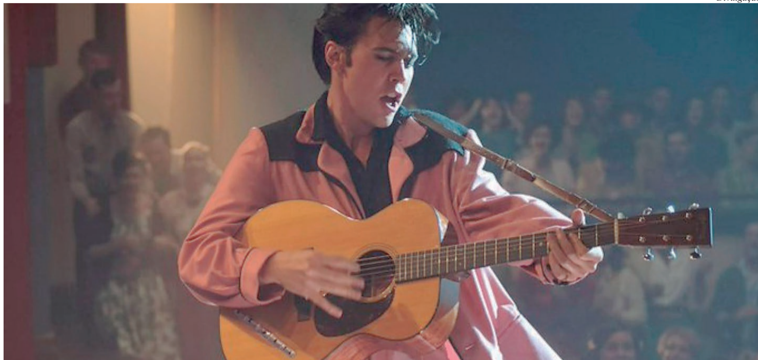
Elvis é interpretado por Austin Butler, que chamou atenção pela semelhança física nas filmagens

Elvis vai contar toda a trajetória do artista e como foi sua relação conflituosa com seu empresário Tom Parker, uma relação empresarial que durou por cerca de vinte anos, começando no início da carreira do cantor até o auge da sua fama.