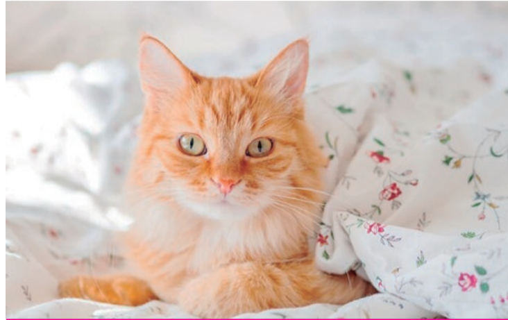
Os pets também sofrem com a queda das temperaturas

“Apesar dos gatos sentirem frio assim como os cães, a diferença é que os gatos não têm uma camada de pelo tão densa. Existem ainda algumas raças totalmente desprovidas de pelos, como os Sphynx, que são mais vulneráveis