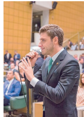
Deputado Thiago Auricchio

Sobre o Código Paulista de Defesa da Mulher - O documento, inédito no país, centraliza num único lugar mais de 50 anos de leis protetivas das mulheres. O Código traz clareza, facilitando a consulta e a preservação dos direitos.