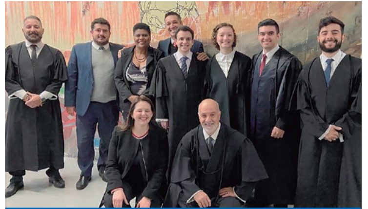
Descontração de professores e alunos antes de iniciar o júri simulado