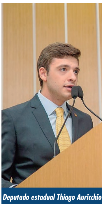
Deputado estadual Thiago Auricchio

Uma das mais importantes ações da área da Saúde do Grande ABC está prestes a completar 3 anos de funcionamento. Inaugurada em outubro de 2019, a Farmácia de Alto Custo de São Caetano do Sul já contabiliza mais de 305 mil atendimentos, com 7,3 milhões de medicamentos distribuídos.