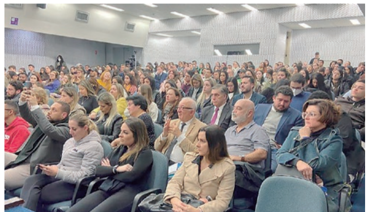
Auditório da USCS ficou lotado

De 23 a 26 de agosto de 2022, a Universidade Municipal de São Caetano do Sul (USCS), por meio do seu curso de Direito, promove a XXV Semana Jurídica. A atividade é promovida em parceria com a OAB-SP - Subseção São Caetano do Sul e marca os 25 anos do curso de Direito da Universidade. As atividades acontecem no Auditório Helcio Quaglio, no Campus Barcelona (Av. Goiás, 3400, Barcelona SCS), nos períodos da