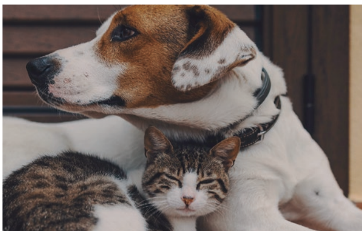
Uma decisão mal tomada pode prejudicar bem-estar de cães e gatos

A automedicação é uma prática que acontece, infelizmente. "É preciso entender que o uso indevido de medicação, principalmente de antibióticos, pode