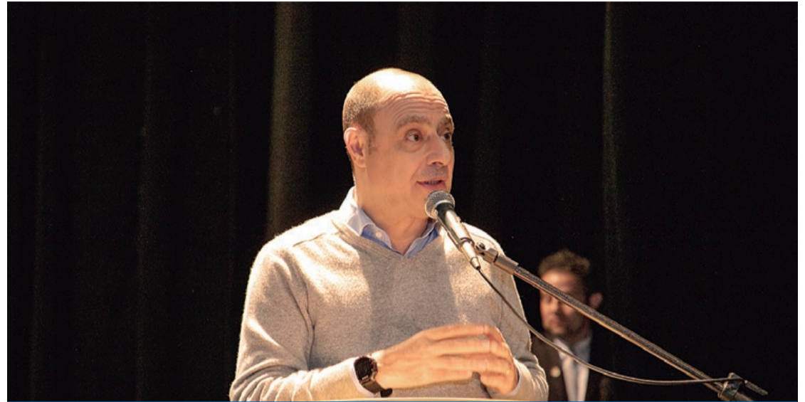
A norma é voltada à proteção de mulheres em situação de violência

O Programa Patrulha Maria da Penha tem como objetivo garantir a efetividade da Lei Maria da Penha (Lei Federal nº 11.340, de 07 de agosto de 2006), integrando ações de enfretamento à violência contra as mulheres, estabelecendo relação direta