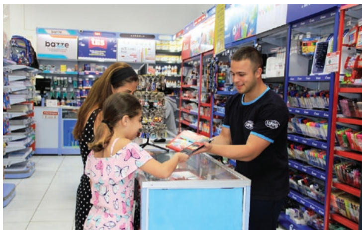
Lupapel tem atendimento diferenciado

Outra dica importante para quem quer começar o ano sem dívidas, é aproveitar parte do 13º salário para a compra do material escolar, uma vez que as listas já foram entregues pelas escolas aos pais e alunos. Também, procurar por uma loja que ofereça variedade de produtos, preços justos