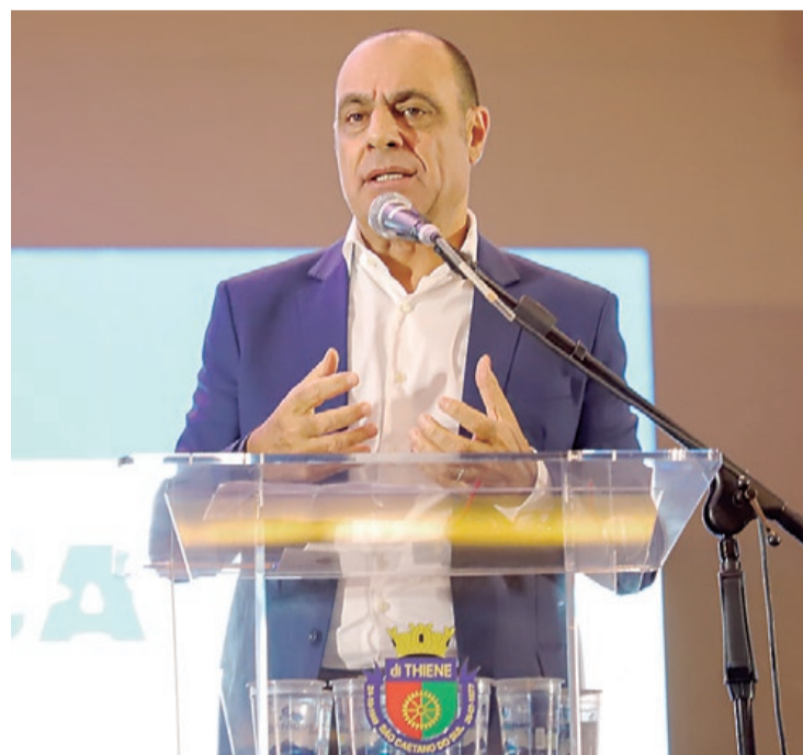
O chefe do Executivo destacou as 15 obras mais significativas

“O prefeito tem como características marcantes a ousadia e o compromisso com a melhora da vida das pessoas. E assim deixa a sua marca no desenvolvimento da cidade”, avaliou o deputado estadual Thiago Auricchio, que contribuiu diretamente pela viabilização do Atende Fácil Saúde, do Novo Viaduto Independência, do Hospital Veterinário Universitário Municipal e outras grandes intervenções do Avança São Caetano.