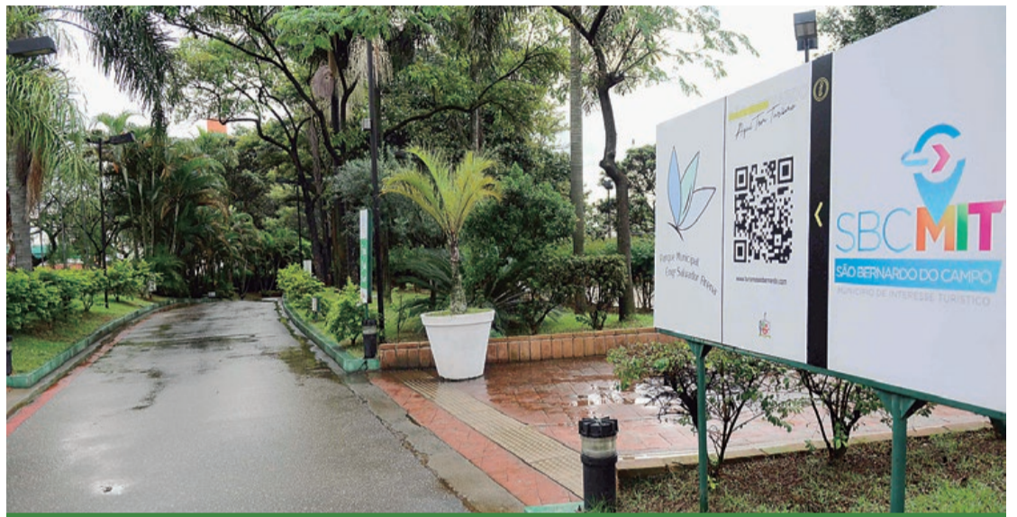
Ao todo, serão investidos cerca de R$ 2 milhões com a reforma

INTERVENÇÕES - O Parque Engenheiro Salvador Arena passará por completa revitalização, desde a modernização da fachada do parque, com nova pintura e