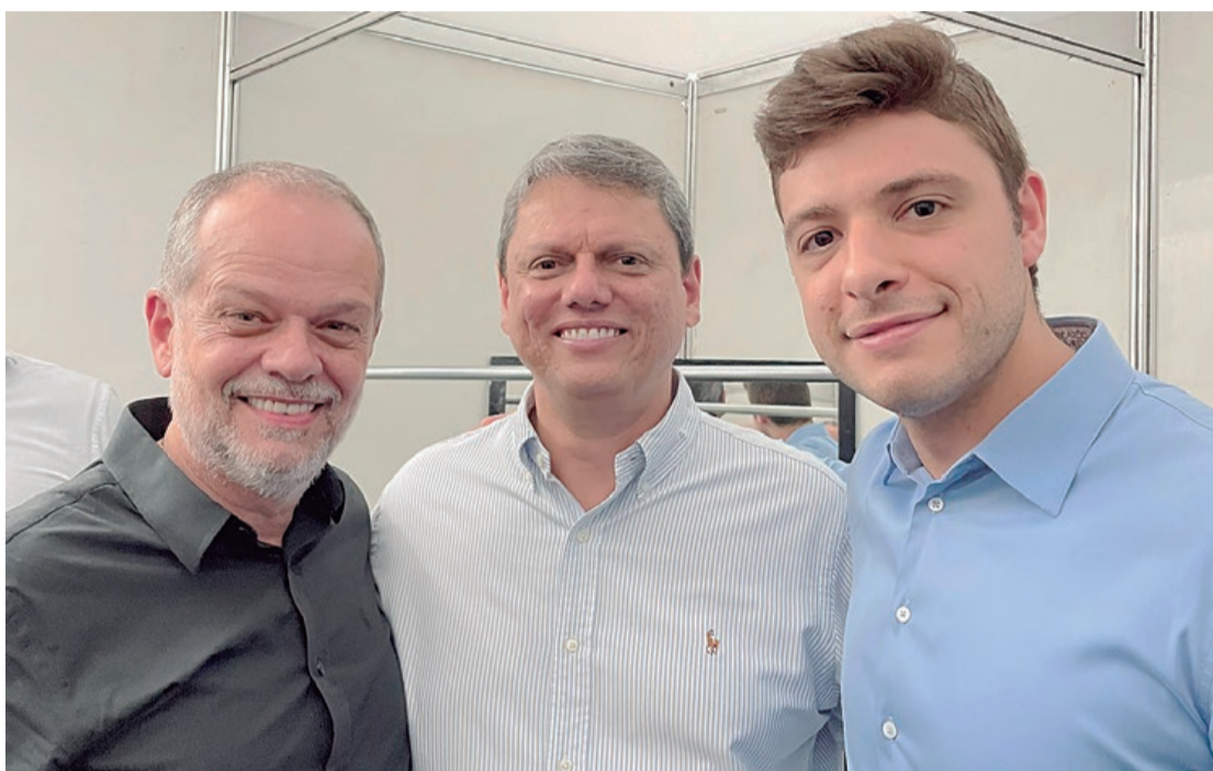
Pré-candidato a prefeito Tite Campanella, governador Tarcísio de Freitas e deputado estadual Thiago Auricchio