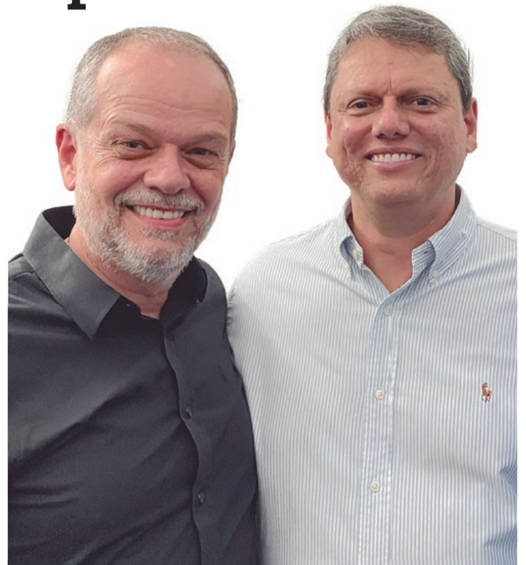
Tite Campanella com o governador do Estado Tarcísio de Freitas

Tite Campanella ressaltou que a educação será uma de suas prioridades. “O grande desafio dos próximos anos, além de manter tudo aquilo que conquistamos, vai ser crescer no que falta crescer. A educação é um enorme desafio que nós temos para o futuro da nossa cidade, para o futuro dos nossos jovens e para o futuro das nossas crianças. Vamos nos debruçar muito sobre isso e eu tenho certeza que ao lado da Regina, de uma forma moderna, republicana e muito solidária vamos juntos traçar os novos destinos de São Caetano do Sul”, declarou o pré-candidato.