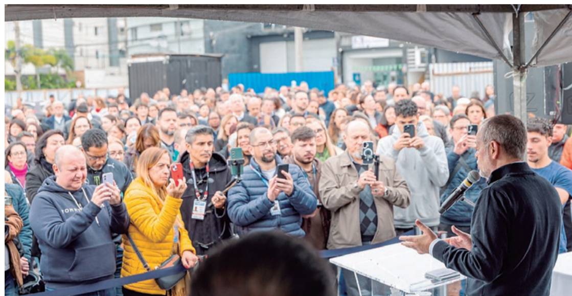
Com investimento de R$ 52,4 milhões, a unidade será construída na Rua Heloísa Pamplona

O projeto foi concebido para atender estudantes da Educação Infantil e do Ensino Fundamental, reunindo ambientes pedagógicos modernos, espaços de convivência, áreas esportivas e soluções sustentáveis,