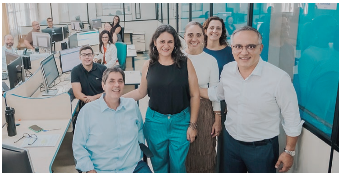
Essa foi a primeira vez que a cidade alcançou nota A do Tesouro Nacional

“Desde o início da nossa gestão, em 2025, temos trabalhado com seriedade, planejamento e responsabilidade para modernizar os