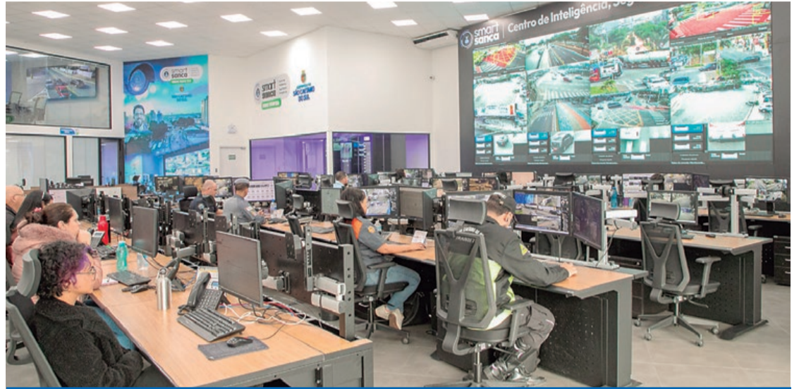
Smart Sanca já contribuiu diretamente na captura de mais de 200 foragidos da Justiça

O Smart Sanca integra tecnologia de monitoramento em tempo real, reconhecimento facial e cruzamento de dados com os principais