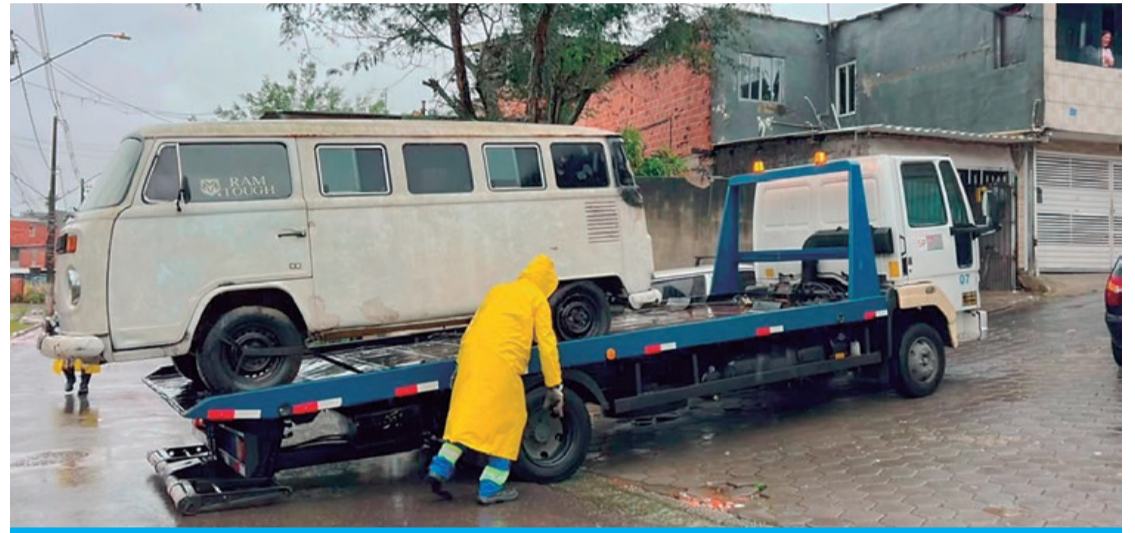
Iniciativa tem como objetivo melhorar a segurança viária e preservar a saúde pública

“O cuidado com a cidade passa também pela organização dos espaços públicos. A Operação Carro Abandonado contribui para a segurança da população, melhora a mobilidade urbana e ajuda a manter os bairros mais limpos e bem cuidados. Estamos ampliando esse trabalho em diversas